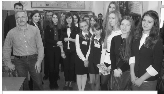
Члены жюри и участники секции "Экология животных. Полевой и лабораторный эксперимент"

В Гомельском областном лицее состоялся очередной XXVI областной этап Республиканского конкурса научных биолого-экологических работ учащихся учреждений общего среднего и дополнительного образования "Молодежь и экологические проблемы современности".