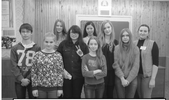
Участники областной олимпиады по китайскому языку вместе с членами жюри