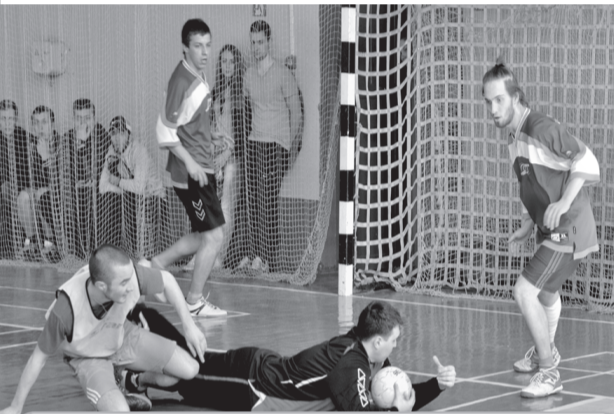
Момент финального матча между командами юридического и физического факультетов.