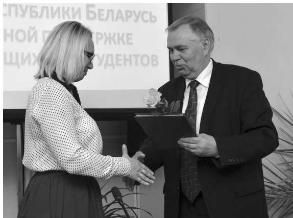
Наш корр.