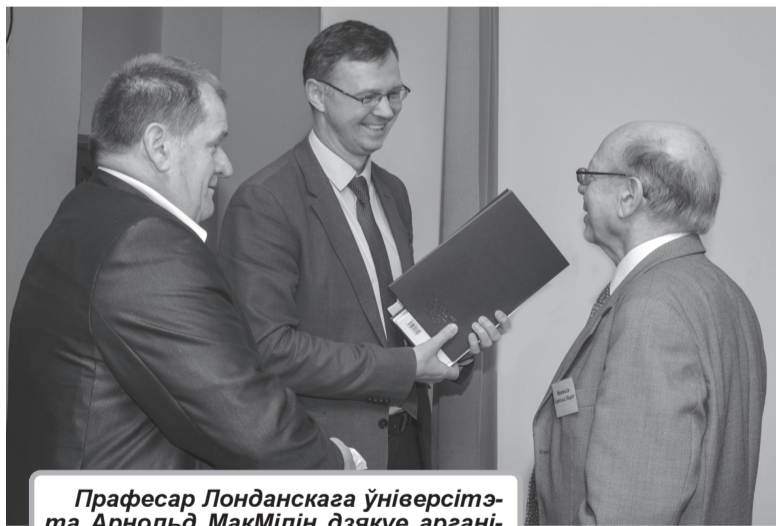
Прафесар Лонданскага ўніверсітэта Арнольд МакМілін дзякуе арганізатарам чытанняў за цёплы прыём

У Гомелі прайшлі Міжнародныя навуковыя чытанні "Рэгіянальнае, нацыянальнае і агульначалавечае ў славянскіх літаратурах", прысвечаныя памяці народнага пісьменніка Беларусі, акадэміка Івана Навуменкі.