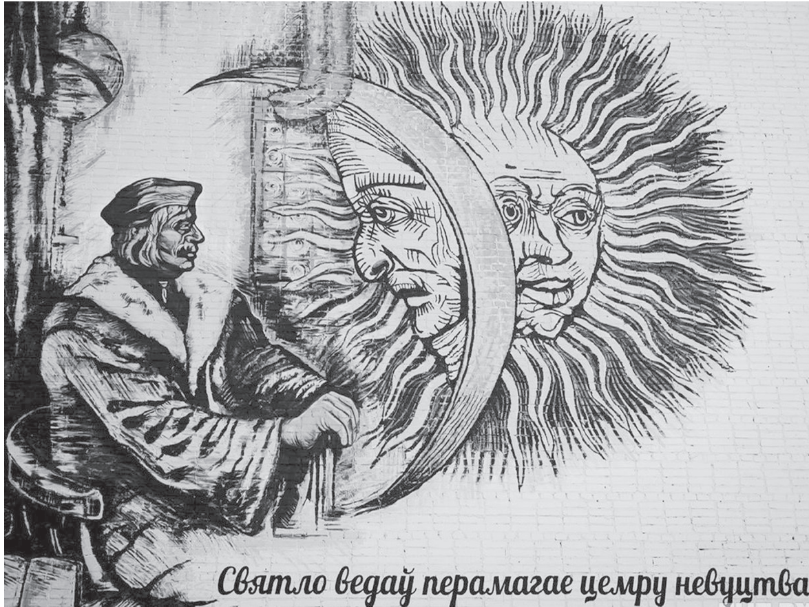
Святло ведаў перамагае цемру невуцтва

Вялікія асобы ніспасланыя звыш. Іх жыццё належыць усяму сусвету, яны ствараюць гісторыю, змяняюць лёс чалавецтва, жывуць ідэяй зрабіць свет лепшым. Над іх подзвігам не ўласны час, ён не падлягае забыццю, не цьмянее праз стагоддзі, вечна і велічна адукаецца ў думках і сэрцах нашчадкаў.