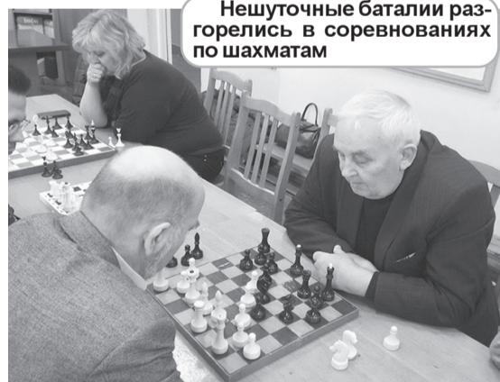
Нешуточные баталии разгорелись в соревнованиях по шахматам

Победители и призеры в личном зачете на-