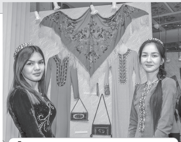
Туркменские студентки представили свою страну на выставке, посвященной традициям и культуре народов мира

На торжественном приеме волонтеров учреждений образования Центрального района дипломами "За развитие волонтерского движения в Центральном районе" были награждены волонтерские отряды "Лесовод"