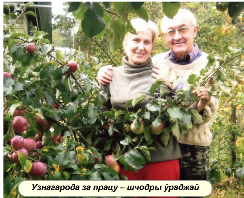
Узнагарода за працу — шчодры ўраджай

Ці шчаслівай выпадковасцю стаў для маладога спецыяліста гэты паварот лёсу? Сёння прафесар не сумняваецца ў адказе на гэтае пытанне — працы ва ўніверсітэце ён аддаў 45 гадоў, у Гомелі знайшоў сваё жыццёвае