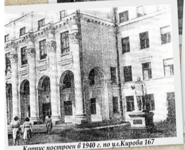
Корпус построен в 1940 г. по ул. Кирова 167