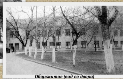
Общежитие (вид со двора)

общежития, вокруг него посадили деревья, оно утопало в зелени. Строительство же собственного учебного корпуса еще только начиналось... Первое новенькое общежи-