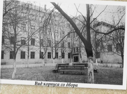
Вид корпуса со двора

Для студентов правила предусматривали утренний подъем в 7 часов по звонку (в выходной день в 8 часов), отбой в 24.00 по первому сигналу, прекращение передвижения по общежитию в 00.30. Запрещалось лежать на