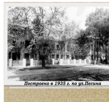
Построено в 1935 г. по ул. Песина

9 июля 1930 г. газета "Палеская праўда" саабшчыла, што в Гомеле "с новаго учебногo года открываецца педагагічскі інстытут с двухлетнім курсом обучения, рассчитанный на 300 человек". Гомельскі Окрисполком решил разместить его в новом здании школы-семилетки по ул. Пролетарской (для занятий во вторую смену) и в других учреждениях города. Целое десятилетие педагогический коллектив жил в ожидании собственного учебного корпуса. В 1935–1936 учебном году, наконец, завершилось строительство первого студенческого