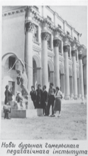
Новы будынак Гомельскага педагагічнага інстытута

Новая рубрика "Листая стары альбом" будзе раскрываць увлекательныя старонкі гісторыі нашага вуза. Як шло строітельство універсітэта, як протэкалі будні і празнікі першых преподавателей і студентов, какие события стали определяющими в становлении ГГУ имени Ф. Скорины... Об этом и многом другом повествуют архивные документы и фотографии, которые мы рады представить вниманию читателей.