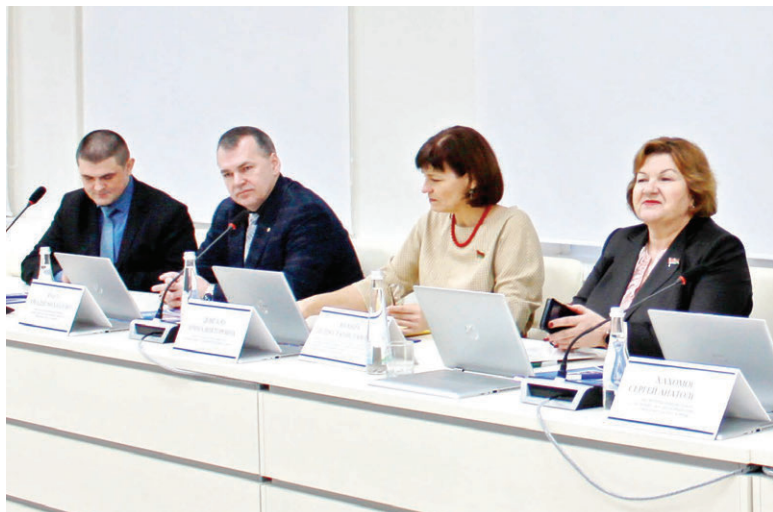
Народное вовлечение в дискуссию придает особую значимость предстоящим реформам.

На встрече говорили о предстоящем референдуме, внешних