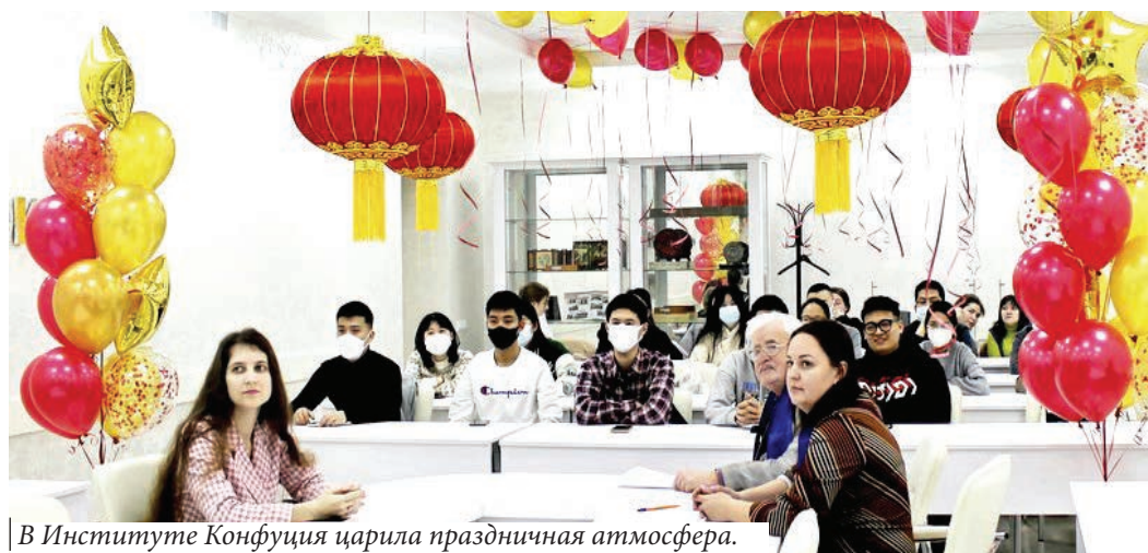
В Институте Конфуция царил праздничная атмосфера.

Праздник фонарей (Юаньсяоце) – один из древнейших праздников в Китае. Он проводится в 15-й день первого лунного месяца и завершает двухнедельное празднование китайского Нового года – фестиваля весны.