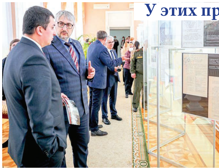
Многие посетители задерживались у витрин с личными вещами мирных граждан.

Студенты и преподаватели ГГУ посетили фотодокументальную выставку «Прощайте, люди...», которая открылась в южной галерее дворца Румянцевых и Паскевичей. Ее организаторами выступили дворцово-парковый ансамбль, прокуратура и архивы Гомельской области.