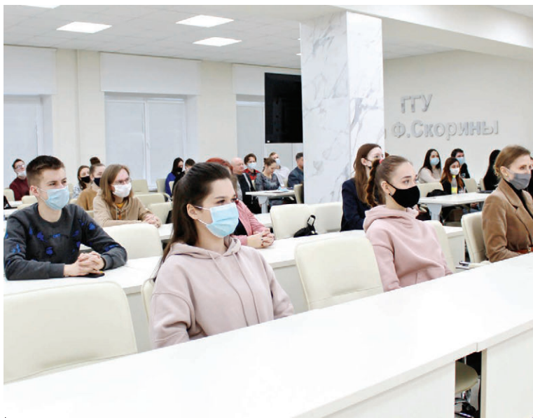
На диалоговой площадке молодежь могла задать все интересующие вопросы.

По мнению Лилии Ананич, любые преобразования должны носить эволюционный характер, потому что сломать всегда легко, а построить – трудно: