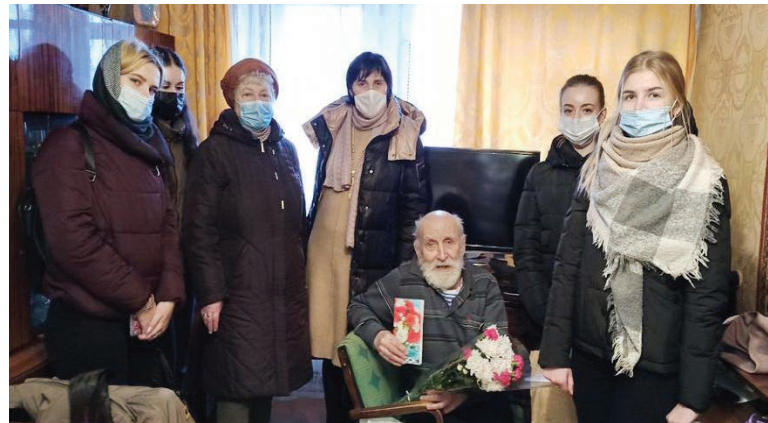
Людам пожилого возраста важны внимание и забота.