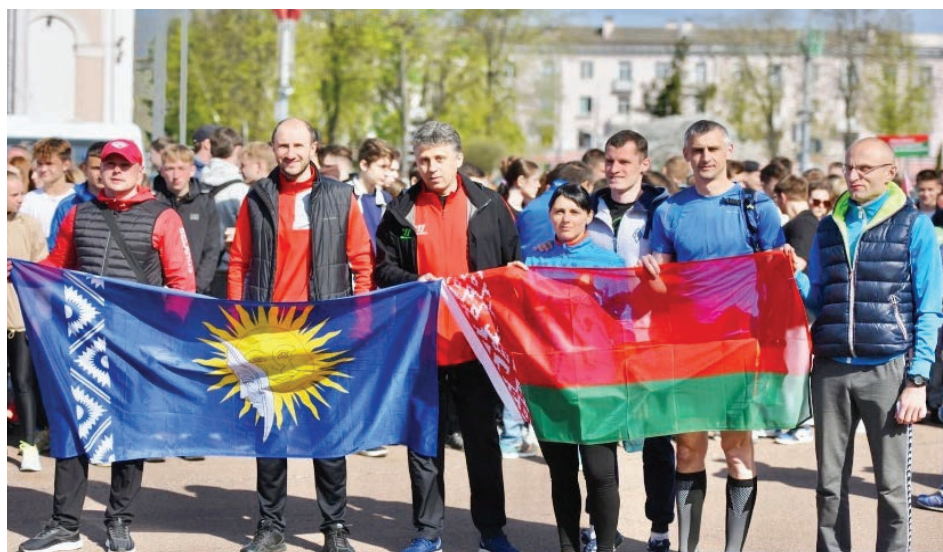
«В едином забеге под флагом страны» – под таким названием прошел общерегиональный спортивный легкоатлетический забег. Он объединил более 3 000 гомельчан, в том числе и представителей ГГУ.