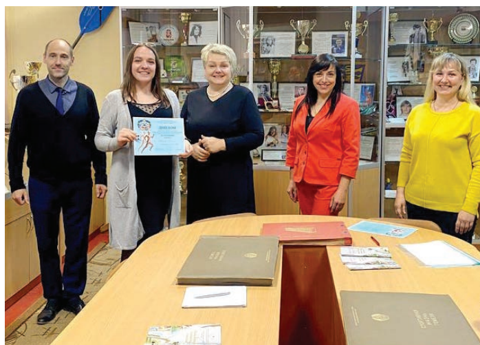
В олимпиаде приняли участие 50 студентов 2-4 курсов факультета физической культуры.

На кафедре теории и методики физической культуры прошла республиканская олимпиада по дисциплине «Анатомия» среди студентов, обучающихся на специальности «Физическая культура».