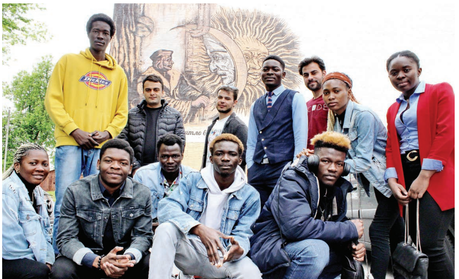
Желаем иностранным студентам пронести теплые воспоминания об alma mater через годы.

Программа включала разноплановые мероприятия. Ключевыми стали олимпиада по русскому языку, межвузовский турнир по мини-футболу на кубок ректо-