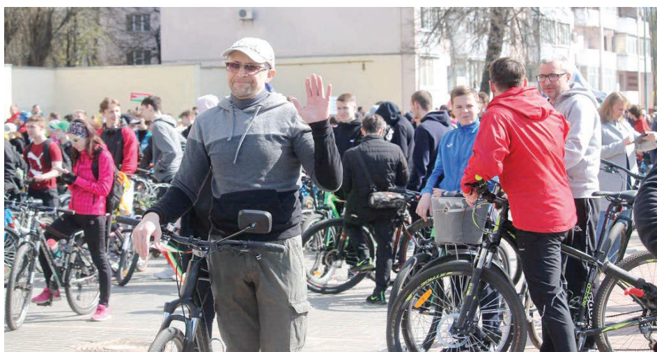
В традиционном весеннем велопробеге приняли участие более тысячи велосипедистов. Инициативу поддержали и представители нашего университета.