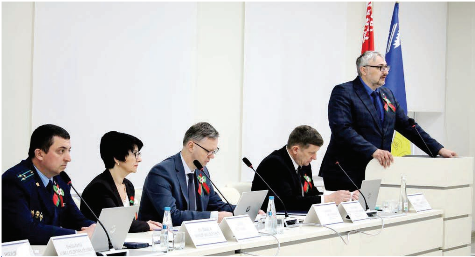
Проведение конференции содействует сохранению исторической памяти о Великой Отечественной войне, патриотическому воспитанию студентов.

В университете прошла Международная научно-практическая конференция «В битвах за волю, в битвах за долю...». Ее организатором наряду с ГГУ выступил горисполком.