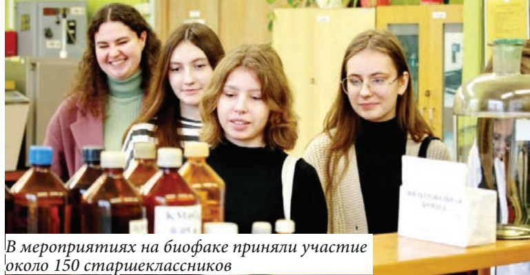
В мероприятиях на биофаке приняли участие около 150 старшеклассников

В ГГУ прошли профориентационные мероприятия для учащихся старших классов школ и гимназий.