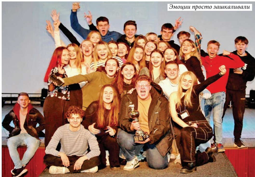
Эмоции просто зашкаливали

Наталья ЛОПАТИНА