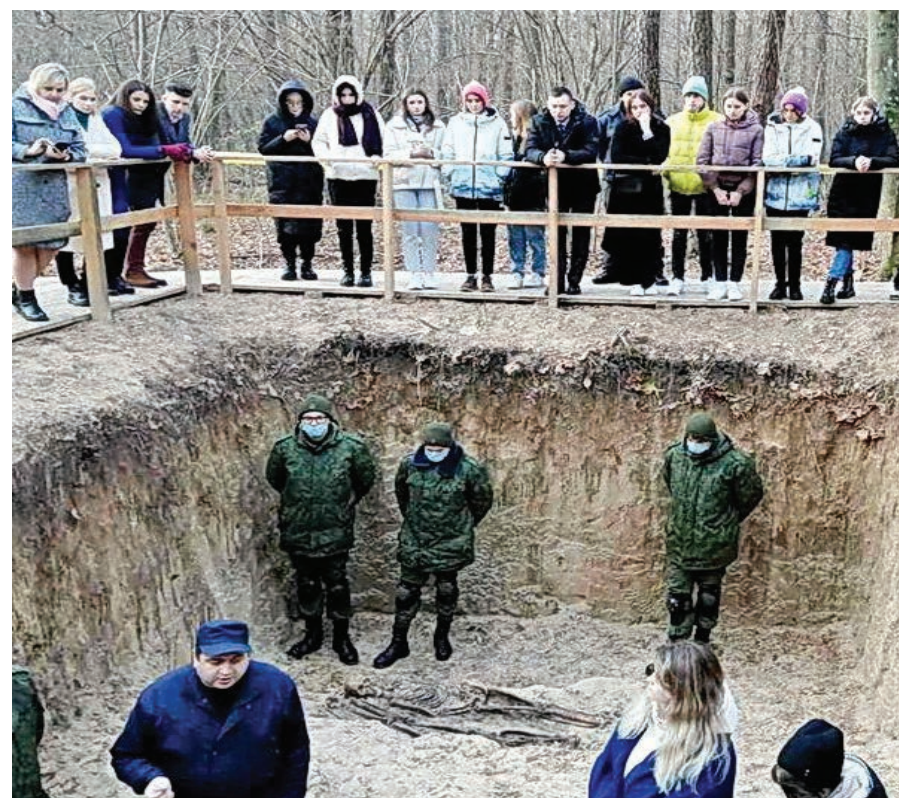
Нацисты организовали здесь настоящий конвейер смерти

Результат масштабной кропотливой работы поискового взвода 52 отдельного специализированного поискового батальона Министерства обороны, сотрудников прокуратуры и экспертных служб – обнаружение на исследованной территории немецких блиндажей, найдено место, где располагалась немецкая расстрельная команда численностью не менее 500 человек, обнаружено 29 расстрельных ям. Нацисты партиями свозили на расстрел молодых женщин, мужчин старше 50 лет, организовав настоящий конвейер смерти. На всех