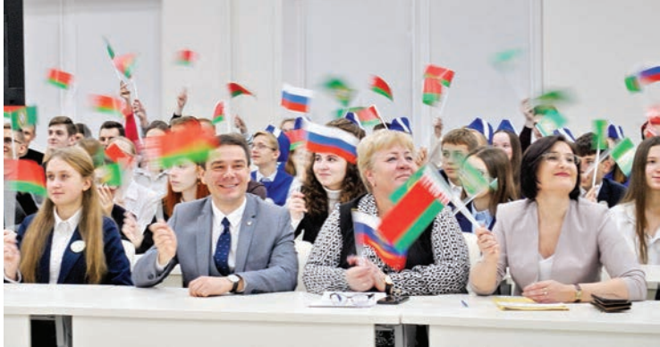
Объединяем прошлое, настоящее и создаем будущее

В ГГУ впервые воссоздали телемост двух государств «Поезд памяти», посвященный 97-летию Героя Советского Союза Михаила Бухтуева.