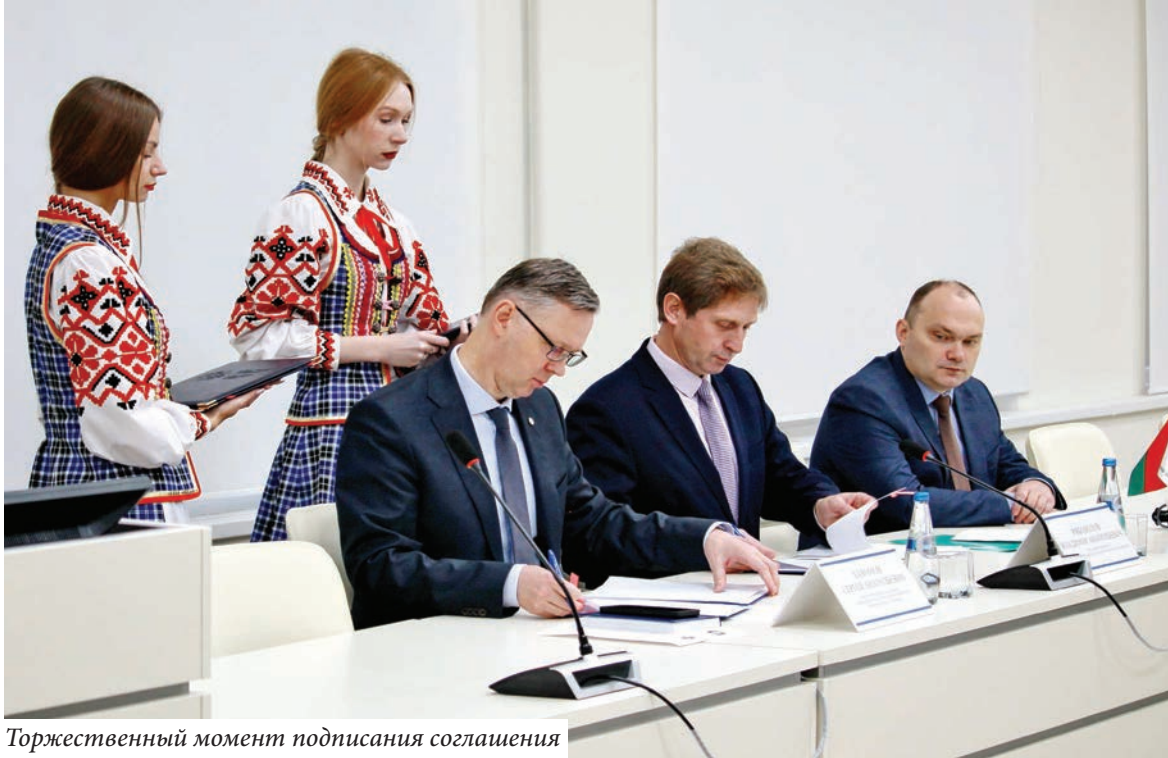
Торжественный момент подписания соглашения

Соглашение о создании Центра поддержки технологий и инноваций между Гомельским университетом и Национальным центром интеллектуальной собственности торжественно подписано.