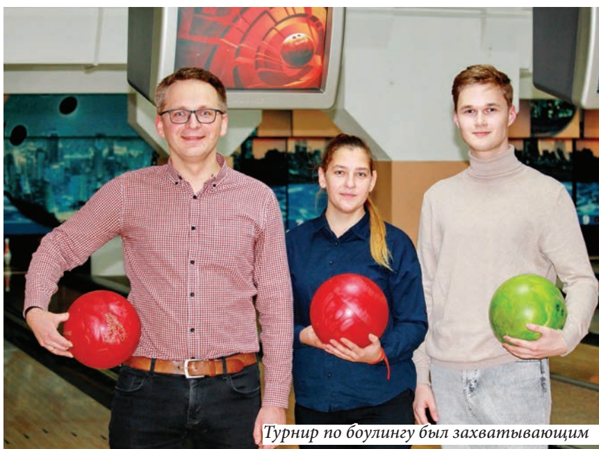
Турнир по боулингу был захватывающим

Пресс-центр ГГУ, фото Александра ЛОПАТИНА