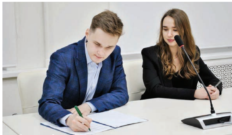
На форуме подписана итоговая резолюция встречи

Впервые на Гомельщине состоялся I Форум студсоветов вузов. Главная тема – «Новые формы сотрудничества студенческих советов высших учебных заведений Гомельской области».