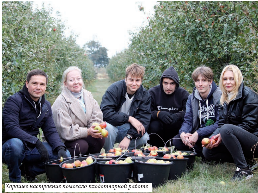
Хорошее настроение помогло плодотворной работе

Более 70 юношей и девушек из факультетов математики и технологий программирования, геолого-географического, юридического, физики и информационных технологий, физической культуры с хорошим настроением трудились на полях сельхозпредприятия.