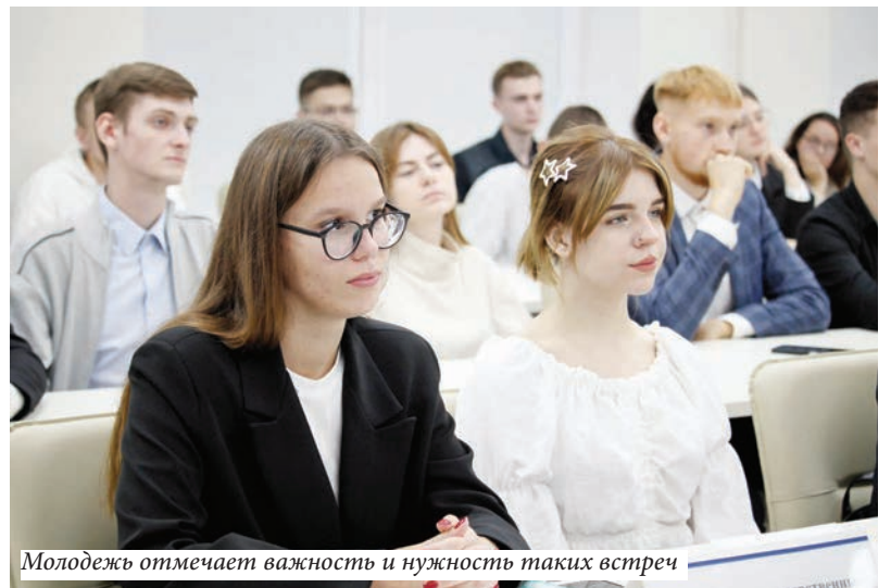
Молодежь отмечает важность и необходимость таких встреч