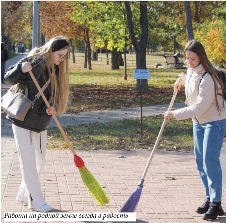
Работа на родной земле всегда в радость

Вооружившись необходимым инвентарем, активисты биофака благоустроивали учебно-научную базу «Ченки». В рамках акции «Студенты ГГУ за чистоту родного города» первокурсники юрфака навели порядок в студенческом сквере, на Аллее Героев и памятнике партизанам-подпольщикам. «Аднавім лясы разам!» – под таким девизом прошла республиканская добровольная акция. В течение недели волонтеры биофака специальности «Лесное хозяйство» помогли работникам лесного хозяйства в восстановлении поврежденных участков леса. Они трудились на посадке и дополнении лесных культур сосны в Терюхском лесничестве Гомельского опытного лесхоза.