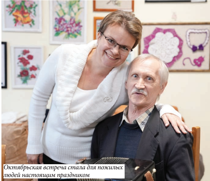
Октябрьская встреча стала для пожилых людей настоящим праздником