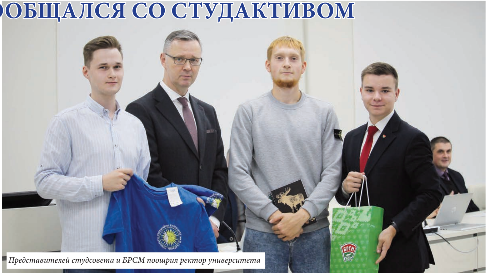
Представителей студсовета и БРСМ поощрил ректор университета