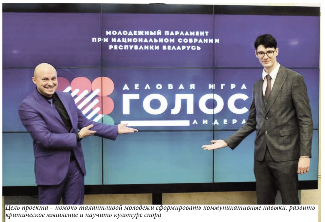
Цель проекта – помочь талантливой молодежи сформировать коммуникативные навыки, развить критическое мышление и научить культуре спора