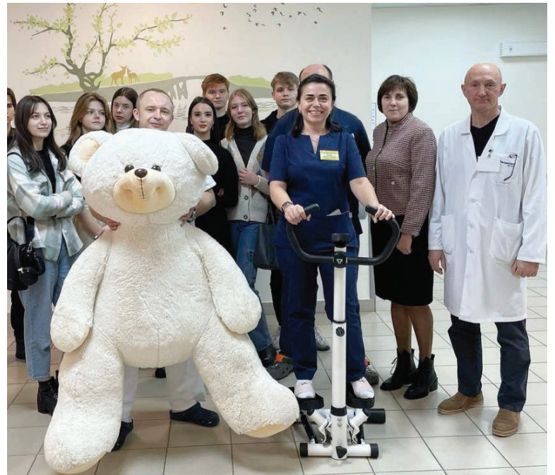
Студенты-волонтеры отряда «Ветеран» подарили Гомельской областной детской клинической больнице тренажер для ходьбы-степпер. Он будет установлен в травматолого-ортопедическом отделении и будет помогать пациентам в реабилитации и скорейшем выздоровлении после травм.