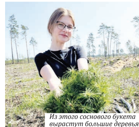
Из этого соснового букета вырастут большие деревья

В Гомельском опытном лесхозе приступил к работе студенческий экологический отряд «Спутник» имени Героя Советского Союза Михаила Семеновича Быкова из числа студентов биологического факультета.