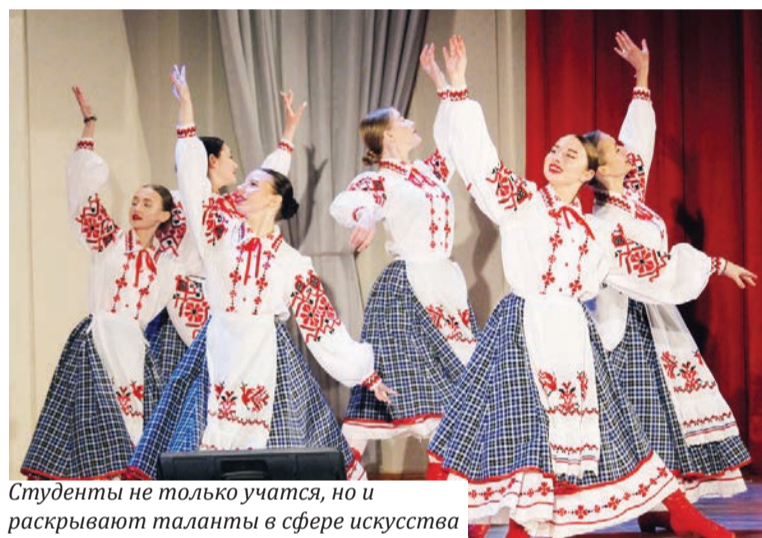
Студенты не только учатся, но и раскрывают таланты в сфере искусства

В Гомельском медуниверситете состоялся областной этап республиканского фестиваля художественного творчества студенческой молодежи «АРТ-вакацыи – 2024».