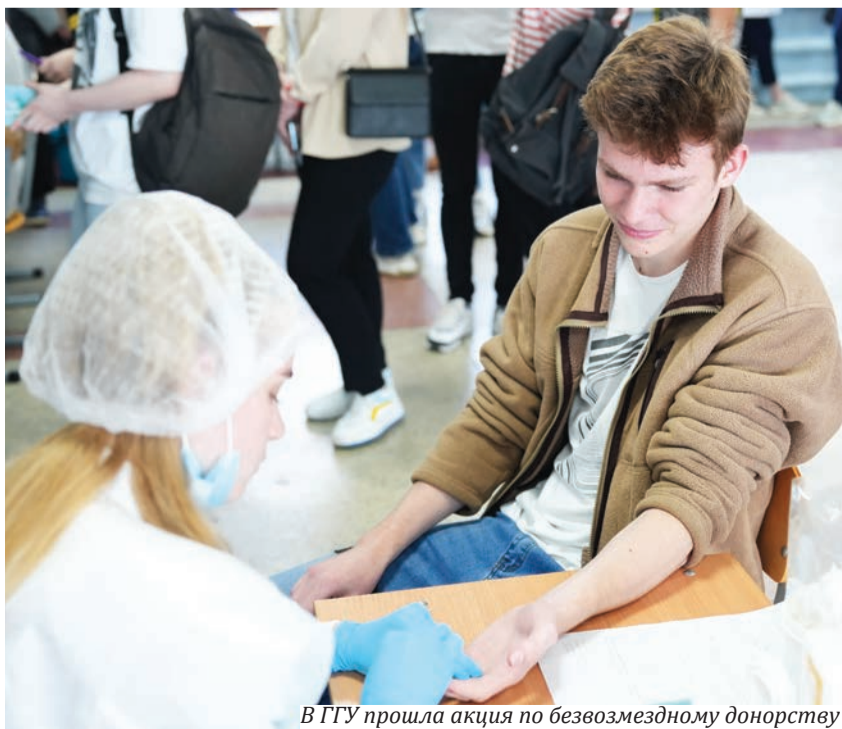
В ГГУ прошла акция по безвозмездному донорству