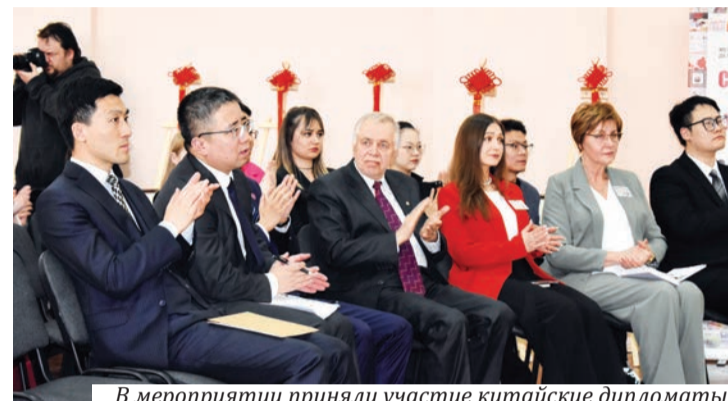
В мероприятии приняли участие китайские дипломаты