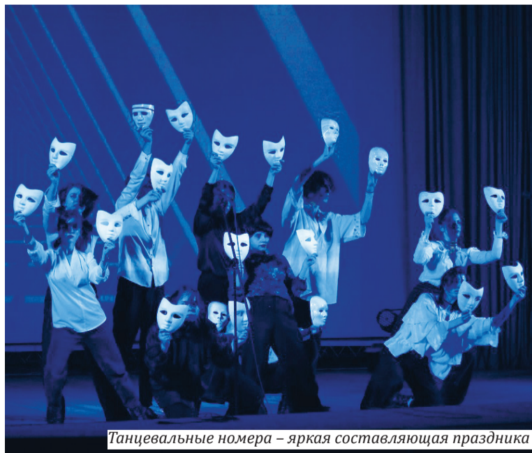
Танцевальные номера – яркая составляющая праздника

Филологический факультет пригласил зрителей на прекрасное мероприятие – концерт-спектакль по мотивам известнейшего романа Михаила Булгакова.