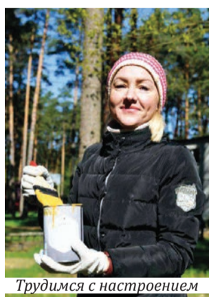
Трудимся с настроением

трудилась на территории оздоровительного лагеря «Луч» в урочище Кленки.