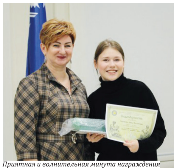
Приятная и волнительная минута награждения