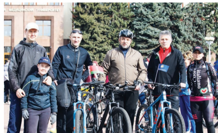
Более 5000 человек присоединились к ежегодному весеннему велопробегу. Общая протяженность маршрута составила 12 километров, но участники их преодолели легко. В мероприятии приняли участие студенты и сотрудники ГГУ.