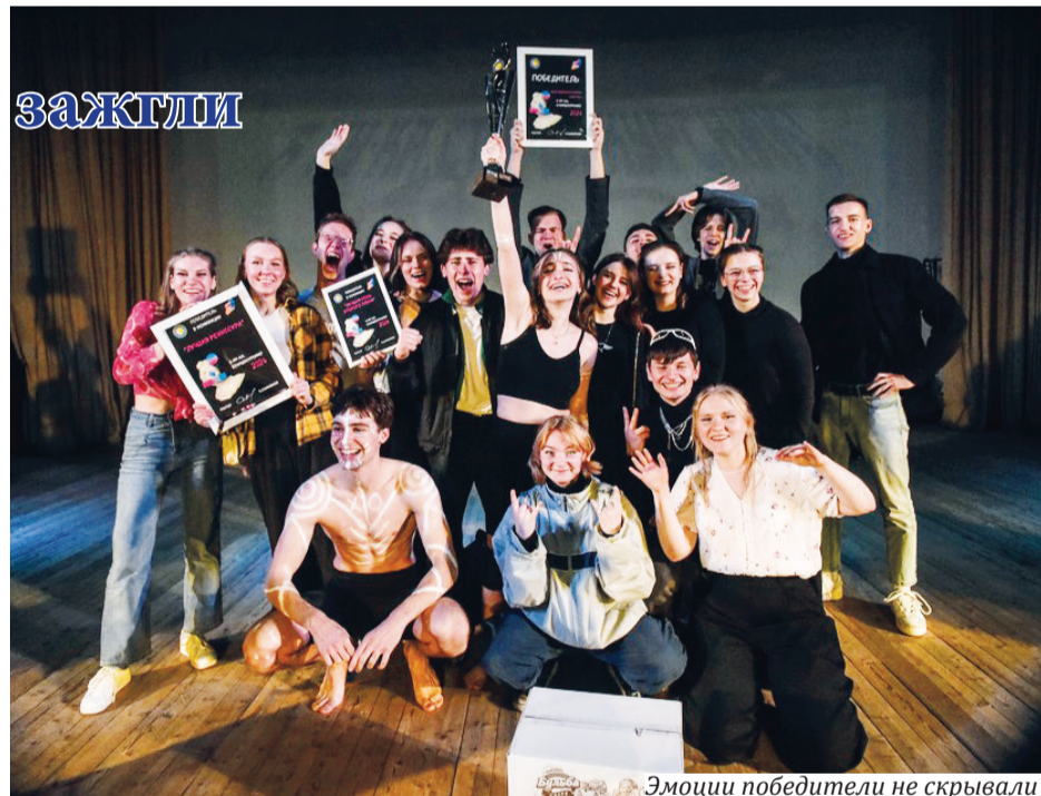
Эмоции победители не скрывали

Наталья ЛОПАТИНА