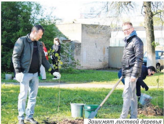
Зашумят листвой деревья