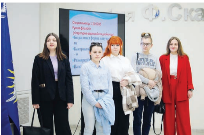
В 2024 году дипломы предстоит получить 776 выпускникам. Буквально через два месяца подготовленные специалисты пройдут итоговую государственную аттестацию, покинут стены родного вуза в новом для себя статусе.