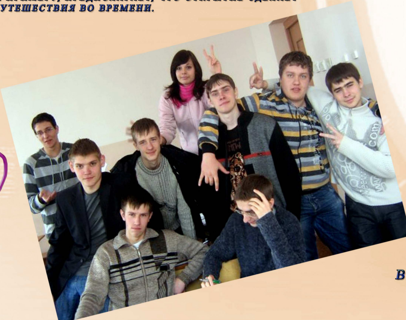
ВЫПОЛНИЛА ГРУППА ФЭ-31