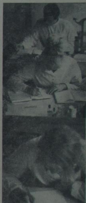
На здымку: студэнты біялагічнага факультэта на практычных занятках у лабараторыі гісталогіі і цыталогіі.

Зварот прынят партыйнай, прафсаюзнай і камсамольскай арганізацыямі Гомельскага дзяржаўнага ўніверсітэта.