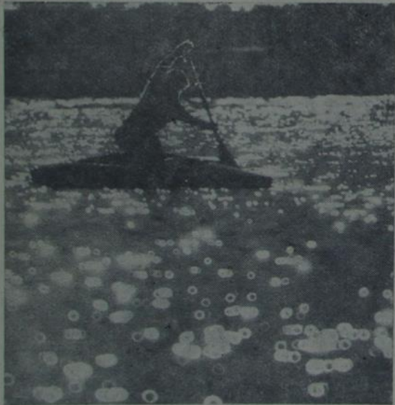
Ой ты, Сож, рака імклівая...