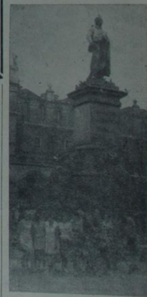
убачыць у рэальным жыцці. У цэнтры рыначнай плошчы размешчаны сукеніцы, пабудаваныя ў XVI стагоддзі на срэчнікунцоў — сукеншчыкаў для продажу сваіх тавараў. Пазней гэты будынак быў упрыгожаны прыбудовамі Італьянскіх скульптараў. М. ПРЫХОДЗЬКА. На здымках: злева — вась ён, горад-музей Кракаў; ўсере — калія пазніка Адаму Міцкевічу. Фота аўтара. (Працяг у наступным нумары).