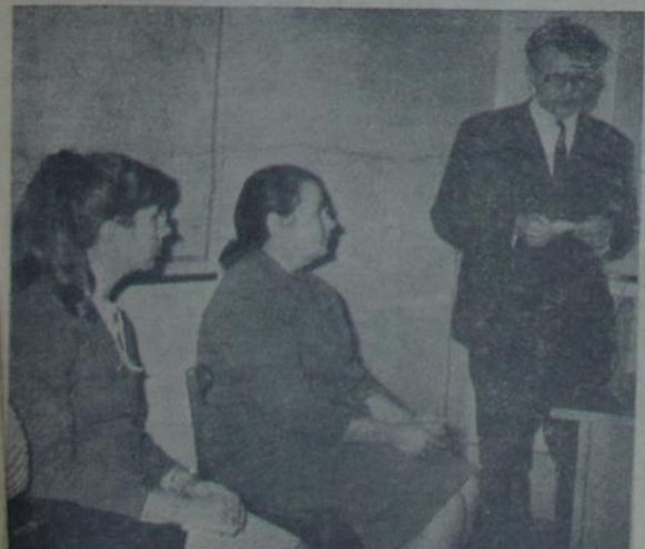
НА ЗДЫМКУ: Ідучы заняткі ў сістэме палітасветы на гісторыка-філалагічным факультэце.