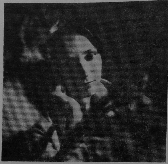
У мінуты роздуму.