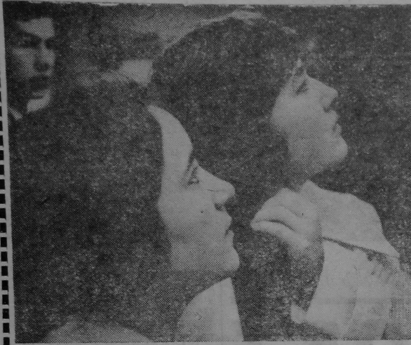
Момант выключнай сканцэнтраванасці і напружанасці. Позіркi гэтых дзяўчат скрыраваны на дошку, дзе вывешаны загад рэктара аб залічэнні абітурьентаў на першы курс.

Прайшлі ці не? Адказ на гэта пытанне дае спіс. Знайшоў сваё прозвішча — радуйся, няма — не сумуй, настойліва рыхтуйся да экзаменаў у наступным годзе.