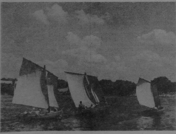
НА ПРАСТОРАХ СОЖА.

Не вей, калі дэкан наступіць на твой «хвост». Студэнтаў па ўясне лічаць. У кішэню не ўсунеш таго, што месціцца ў чужой галаве. Іншыя студэнты падобны яшчарыцы — згубіўшы «хвост», набываюць новы. Чаго не зразумеў на лекцыях — пазнаеш на экзаменах.