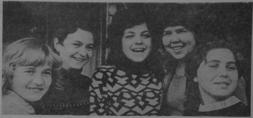
ПРАЛЕТАРЫІ УСІХ КРАІН, ЯДНАЙЦЕСЯ!