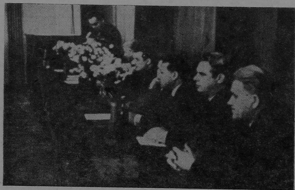
На здымку: у прэзідыуме прафсаюзнай канферэнцыі.

Матэрыял аб справаздачы і выбарах галаўной групы народнага кантролю будзе надрукаваны ў нашай газеце.