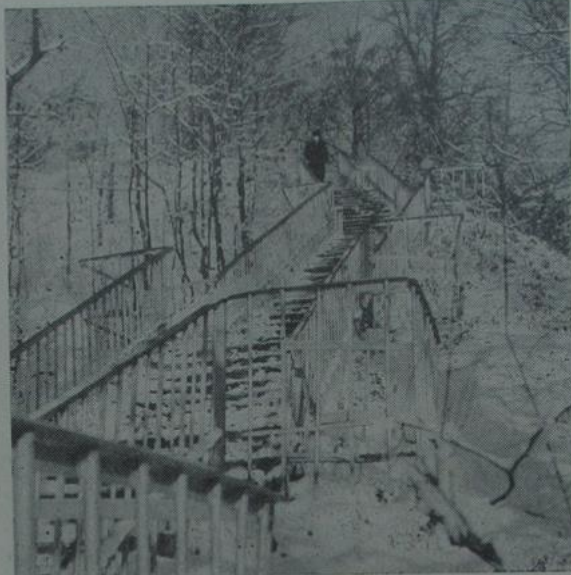
Фотазвод. Прышла зіма жаданая.