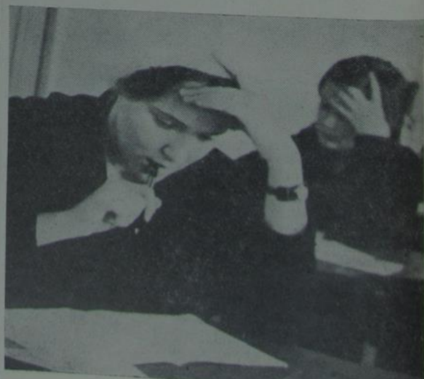
На экзамене ў фізікаў. Дастаніся цяжкія пытанні.