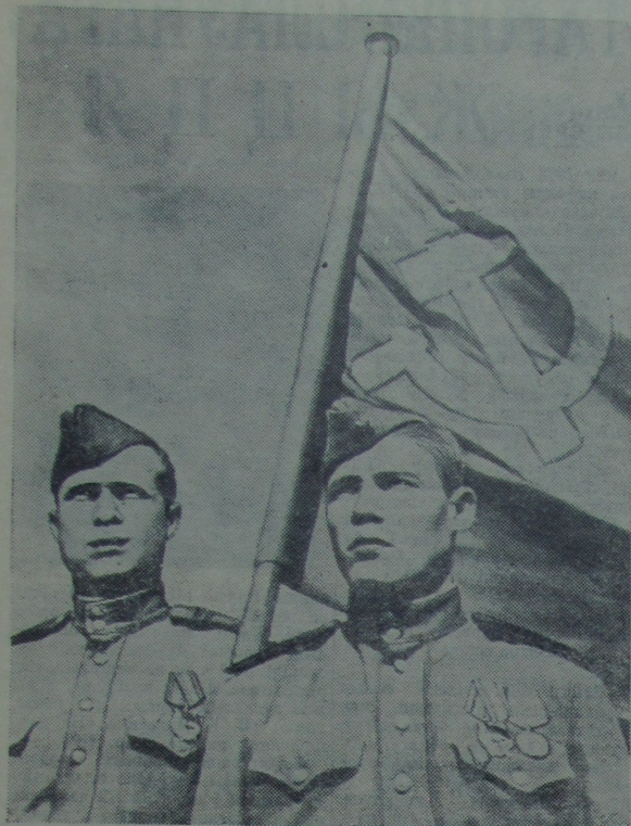
М. Кантары і М. Ягораў, якія ўзялі Савецкі сцяг над рэйхстагам.

М ІНУЛА 29 гадоў з таго часу, калі Савецкая Армія завяршыла разгром нямецка-фашысцкіх захопнікаў. 1418 дзён і начэй працягвалася самая грандыёзная ў гісторыі бітва. Вераломна напайшы на нашу Радзіму, фашысцкая Германія абрушыла на яе удар велізарнай сілы. У першыя дні вайны гітлераўскае камандаванне ўвяло ў дзеянне 191 дывізію, 3712 танкаў, 47260 гармат і мінаметаў. Сухалутныя часці падтрымліваліся прыкладна пяці тысячамі самалётаў і ваенна-марскім флотам. На савецкую зямлю ўступіла больш 5,5 мільёна добра абучаных фашыстаў. Мэта акупантаў была вельмі жудаснай. Яшчэ перад самай вайной на адной з нарад вышэйшых афіцэраў сваёй арміі Гітлер заявіў: «Размова ідзе аб барацьбе на знішчэнне... Вайна будзе рэзка адрознівацца ад вайны на Захадзе. На ўсходзе жорсткасць з'яўляецца дабрабытам для будучага...».