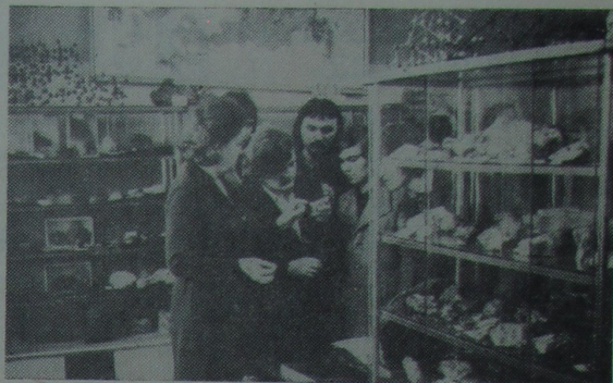
НА ЗДЫМКУ: шмат узораў горных парод сабрана ў геалагічным музеі факультэта.

Ю. ХАДАКОўСКИ, дэкан факультэта, дацэнт.