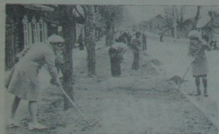
На здымках: 1. Студэнты гр. Г-31 геалагічнага факультэта добраўпарадкоўваюць газоны па вуліцы Песна. 2. Студэнты гр. М-46 механіка-матэматычнага факультэта праводзяць падсадку дрэў ва ўніверсітэцкім парку.

версітэцкага калектыву па закліку сэрца працавалі з падвоенай энергіяй. Яны зрабілі многае для таго, каб усё акалячае нас стала яшчэ больш прыгожым, прыгожым, што перад Першамайскім святэм стварэе прыўзняты і радасны настрой, напаяўнае нас гордасцю за Саўвясельнікаў Айчыны, якая пераможным поступам пад кіраўніцтвам ленынскай партыі набліжаецца да светлай будучыні — камунізму!