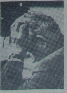
ТАМ ЗДАЮЦЬ НАШЫ?