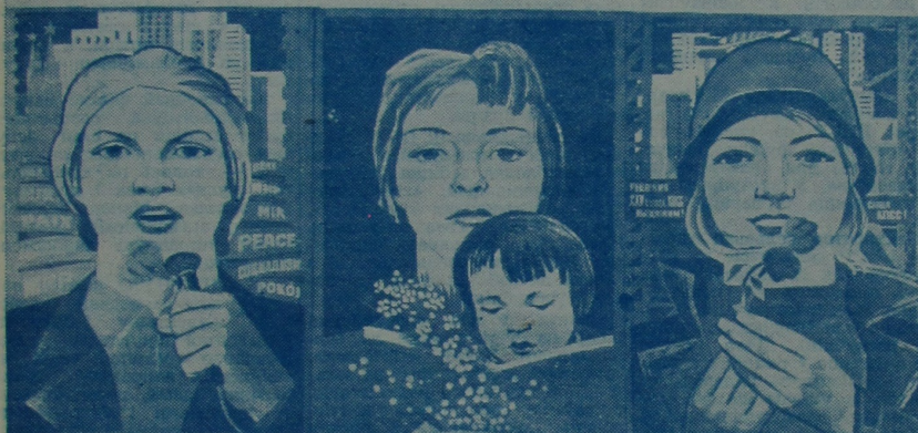
Плакат мастака Э. Арцуняна. Выдавецтва «Плакат».