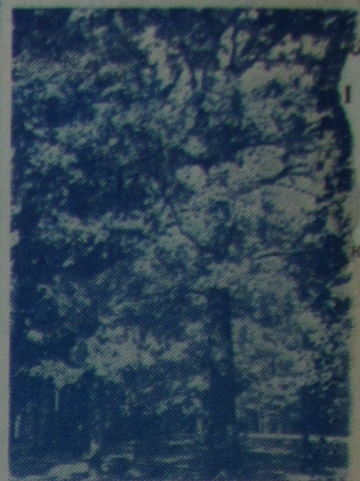
ЗАЛАТАЯ ВОСЕНЬ.

Канчатковыя вынікі агляду-конкурсу будуць падведзены ў чэрвені наступнага года і апублікаваны ў газеце «Гомельскі ўніверсітэт». Факультэт, які зойме 1-е месца ў аглядзе-конкурсе мастацкай самадзейнасці, будзе ўзнагароджаны граматай рэктарата, парткома, камітэта камсамола, прафкома і заахвочаны паездкай для 30 чалавек у г. Ленінград у кастрычніку 1979 года (сродкі выдзяляе прафком). Факультэт, які зойме 2-е месца, узнагароджаецца граматай камітэта камсамола, прафкома і заахвочваецца паездкай у горад-герой Брэст (для 30 чал.). Факультэт, які зойме 3-е месца, узнагароджаецца граматай камітэта камсамола і прафкома, заахвочваецца паездкай у горад-герой Мінск і мемурыяльны комплекс Хатынь. (30 чал.) КАМІТЭТ КАМСАМОЛА, ПРАФКОМ, КЛУБ МАСТАЦКАЙ САМАДЗЕЙНАСЦІ.