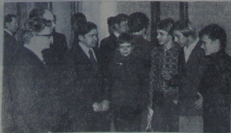
На здымку: вучоныя ГДУ на сустрэчы са школьнікамі.

Не разгубіцца, не стаць у нерашучасці на раздарожжы пасля таго, як у руках будзем трымаць атэстат сталасці, дапамагаюць школьнікам Дні адкрытых дзвярэй, якія кожны год наладжваюцца вышэйшымі навучальнымі ўстановамі, тэхнікумам, вучылішчамі. У час вясяковых канікулаў прыходзяць старшакласнікі і ў наш універсітэт, каб пазнаёміцца з яго факультэтамі, лабараторыямі, даведацца, якіх