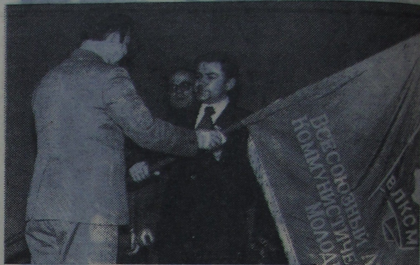
На здымку: уручэнне зводнаму СВА універсітэта пераходнага Чырвонага сцяга абкома ЛКСМБ.

вымпеламі калгаса імя XX партызанскага Слабадзейскага РК ЛКСМБ Малдавіі.