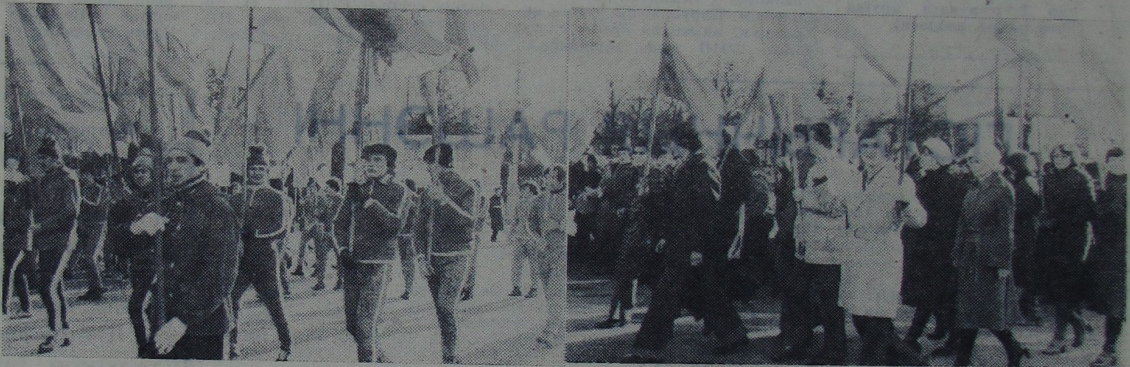
НА ЗДЫМКАХ: 1. У калоне фізкультурынікаў. 2. Выкладчыкі і студэнты ГДУ на святочнай дэманстрацыі.

На святочных урачыстасцях ўніверсітэцкі калектыв яшчэ раз прадэманстраваў сваю адданасць справе камуністычнага будаўніцтва, вернасць ідэалам марксізму-ленінізму, згуртаванасць вакол роднай Камуністычнай партыі і Савецкага ўрада.