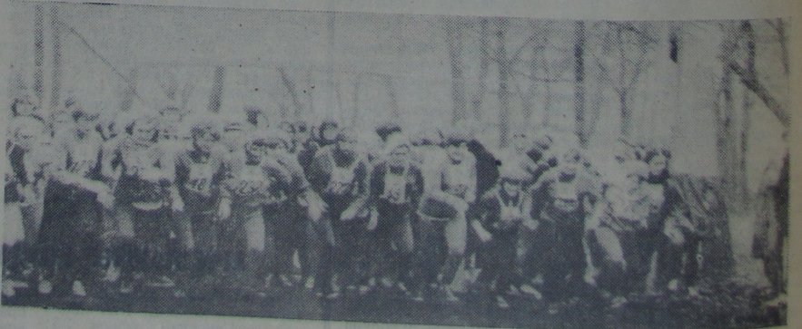
У вострай спартыўнай барацьбе за перамогу на ўніверсітэце прайшоў лёгкаатлетычны крос у гонар 60-годдзя ВЛКСМ.

Праграма — стральба на 25 м з м/к вінтоўкі. Залік па 8 лепшых выніках па першай