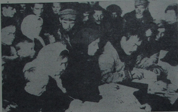
На здымку: слухачы агракасператуўнага гуртка ў калгасе «Энгельс» Гомельскай акругі ў час заняткаў. 1929 год.

З паведамлення аб пуску новай запалкавай фабрыкі «Днепр» у Рэчыцы 16 красавіка 1928 г.