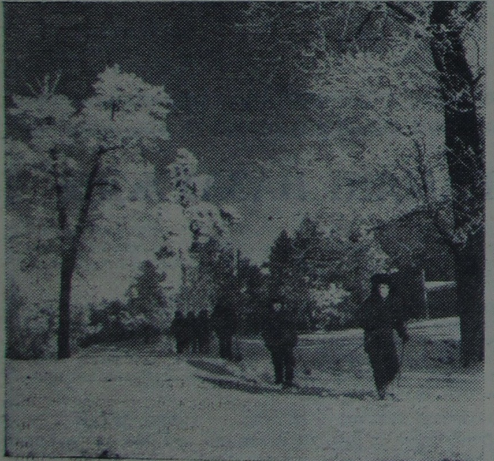
Па першай лыжні.

Герачны подзвіг здзейсніў савецкі народ пад кіраўніцтвам Камуністычнай партыі ў гады Вялікай Айчыннай вайны. «Наша перамога — гэта высокі рубяж у гісторыі чалавецтва. Яна паказала веліч нашай сацыялістычнай Радзімы, паказала веліч камуністычных ідэй, дала цудоўныя прыклады самаахвяравання і героізму», — пісаў Л. І. Брэжнеў у кнізе «Малая зямля». Свой вялікі ўклад у перамогу над ненавісным ворагам унеслі і партызаны. Абапіраючыся на шырокую сетку падпольных партыйных і камсамольскіх арганізацый, Камуністычная партыя надала партызанскаму руху сапраўды ўсенародны характар, характар партызанскай вайны. Партыйныя арганізацыі, якія дзейнічалі ў тыле ворага, вылучылі са свайго асяроддзя шмат таленавітых кіраўнікоў партызанскага руху. Адным