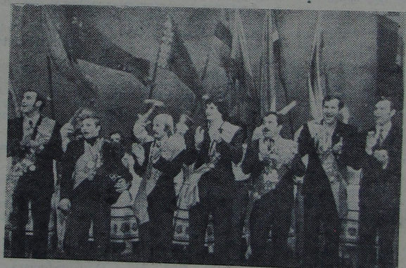
Чэмпіёны розных гадоў. Імі па праву ганарыцца факультэт.