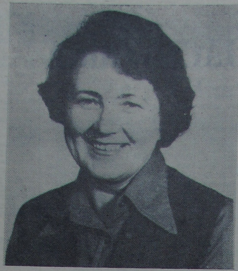
Праз некаторы час маладая настаўніца зноў едзе ў Беларусь. Тут, спачатку працуючы ў Мазыры, а затым у Гомельскім чыгуначным тэхнікуме, яна авалодвае высокім педагагічным вопытам. У