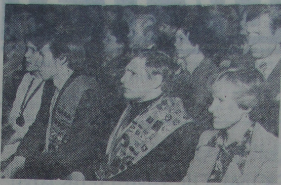
Урачысты вечар праходзіў пры перапоўненай актавай зале.

Факультэт фізыхавання ў сувязі з 30-годдзем і за поспехі ў падрыхтоўцы спецыялістаў уручана Ганаровая грамата Рэспубліканскага камітэта па фізічнай культуры і спорту пры