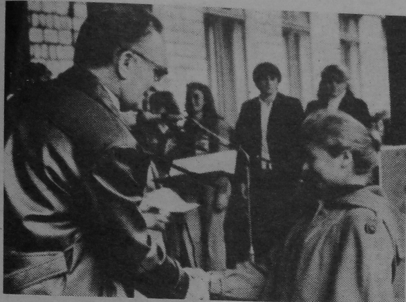
Першыя студэнцкія білеты — медалістам.