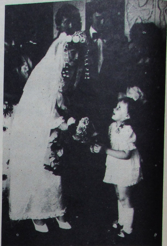
ЖАДАЮ ПЧАСЦЯ.