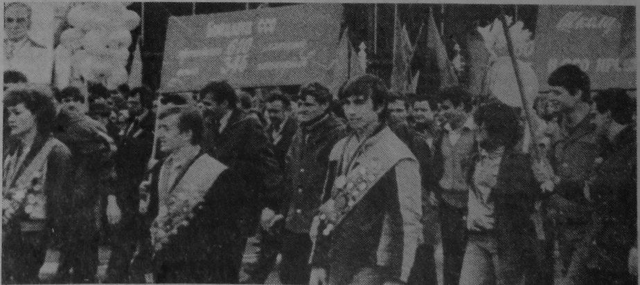
Як і ўвесь савецкі народ, урачыста адзначаюць свята Вясяні, міру і працы — Першамай шматтыражны калектыву нашага ўніверсітэта.

Удзельнікі пасяджэння накіравалі прывітальную тэлеграму ў адрас газеты «Праўда».