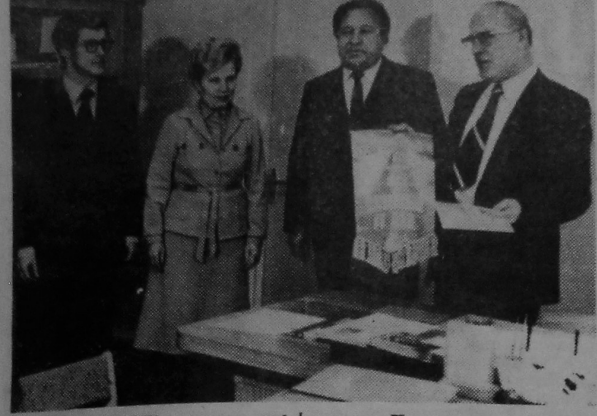
НА ЗДЫМКУ: рэктару ўніверсітэта акадэміку АН БССР Б. В. Бокуццю ўручаюцца ўзнагароды Цэнтральнага г. Гомеля і Веткаўскага РК КПБ.

№ 29 (516) Субота, 30 кастрычніка 1982 года. Гэтая заснавана ў верасні 1969 года. Выходзіць раз у тыдзень. Цана 2 кап.