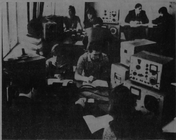
На здымку: у адной з лабараторый кафедры радыёфізікі.