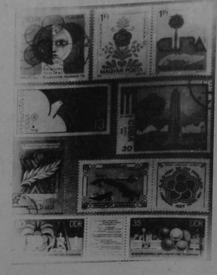
На здымку: маркі, прысвечаныя XI Гаванскаму фестываля.