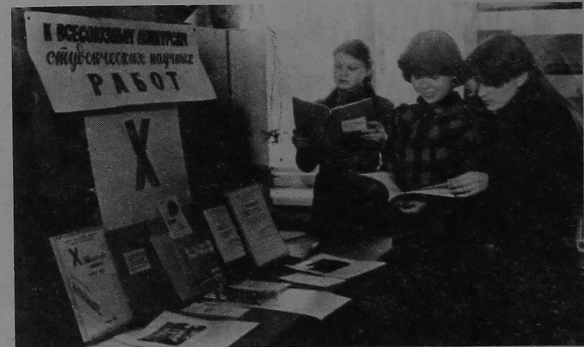
НА ЗДЫМКУ: з прадстаўленымі на выстаўцы студэнцкімі работамі знаёмляцца ўдзельнікі канферэнцыі.