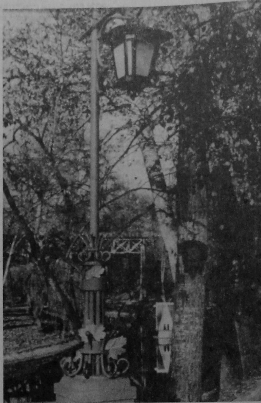
ВОСЕНЬ У ГОМЕЛЬСКИМ ПАРКУ.

Вось такія прагі... Малодшая група школьнікаў занята дробным свавольствам. Мы ўсе з надзеяй чакалі ад яе многага... Як, зрэшты, і ад кожна- га дна нашай практыкі, напоўненай чымсьці няведаным, таямнічым, радасным і, безумоўна, вельмі цікавым. Калектыўная творчасць практыкантаў-філолагаў ГДУ ў СШ № 38 г. Гомеля.