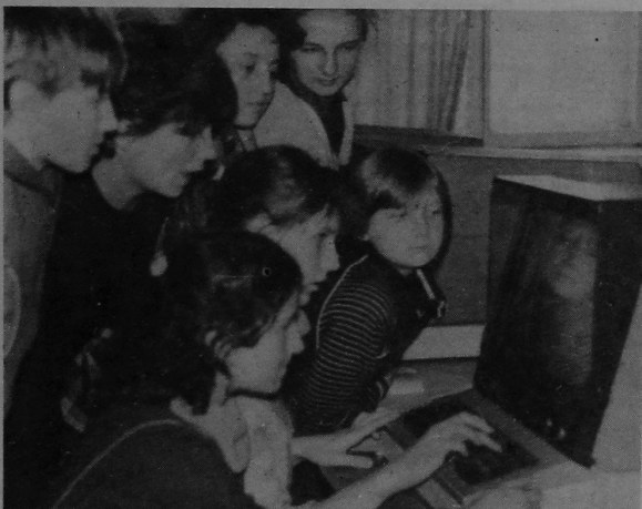
НА ЗДЫМКУ: юныя праграмісты ў час заняткаў.

Г. ЧАРНЫХ, ст. навуковы супрацоўнік кафедры матэматычных праблем кіравання.