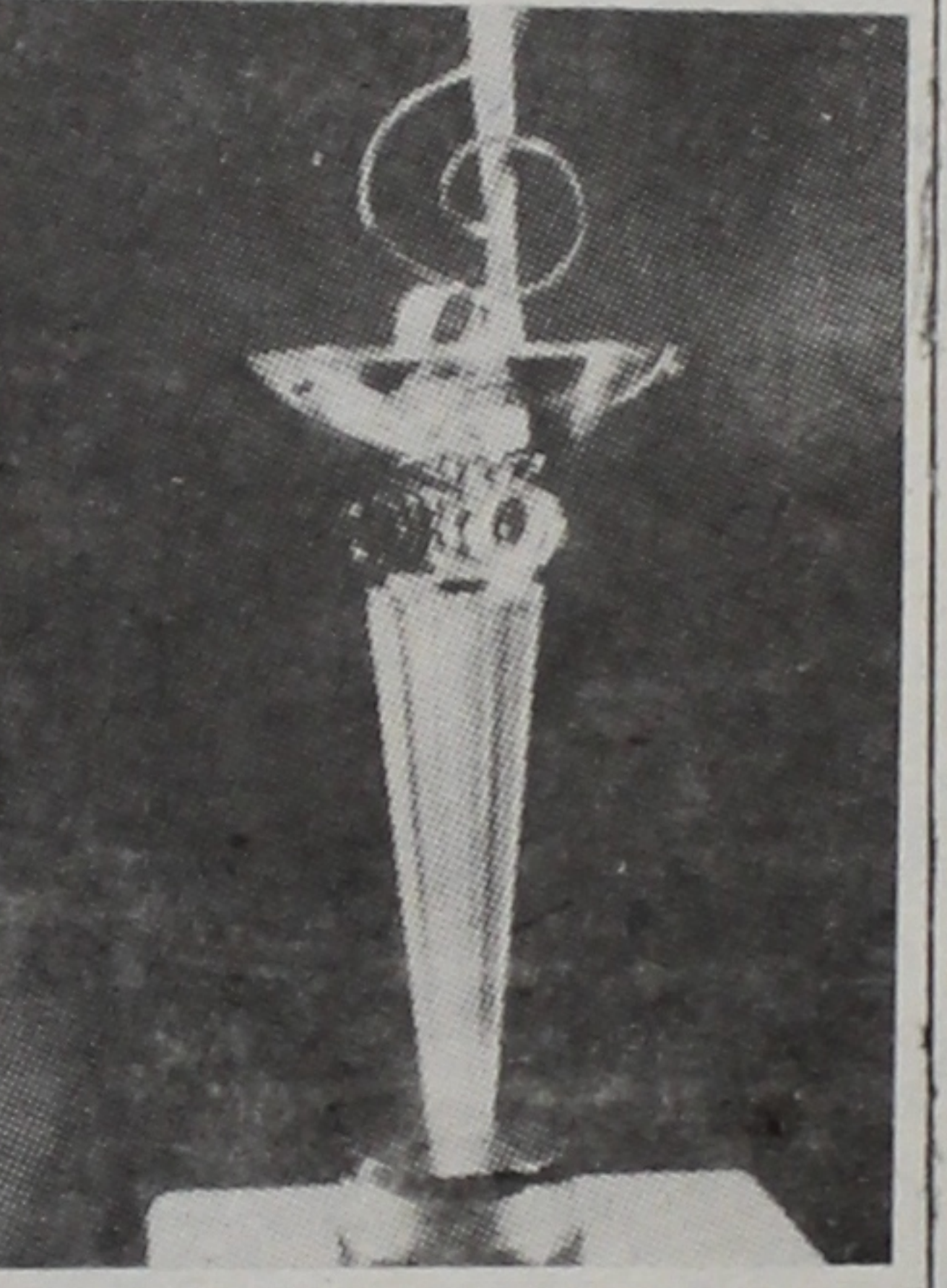
ГЭТЫ ПРЫЗ ДАСТАНЕЦА ПЕРАМОЖЦУ КОНКУРСУ.

М. ШЫРЫНкіНА, мастацкі кіраўнік студэнцкага клуба «Маладосць».