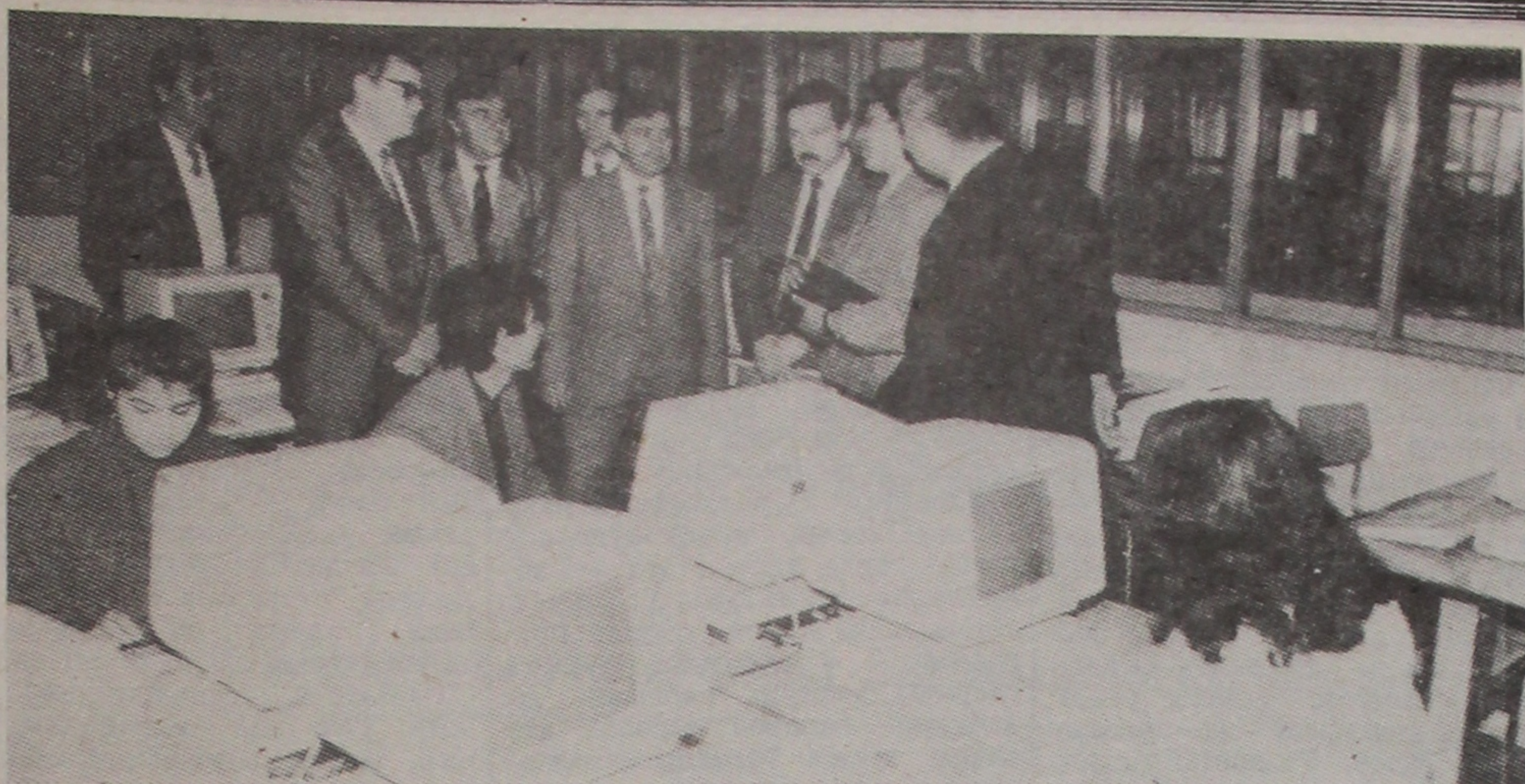
ЗНАЕМСТВА З ПЕКИНСКИМ ПОЛІТЭХНІЧНЫМ УНІВЕРСИТЭТАМ.

Але найбольш вабці Пекін гасцей, турыстаў як горад-помнік са шматлікімі славымі мясцінамі, узрост якіх вызначаецца стагоддзямі і нават тысячагоддзямі. Бадай, галоўнай славісцю сталіцы Кітая з'яўляецца: