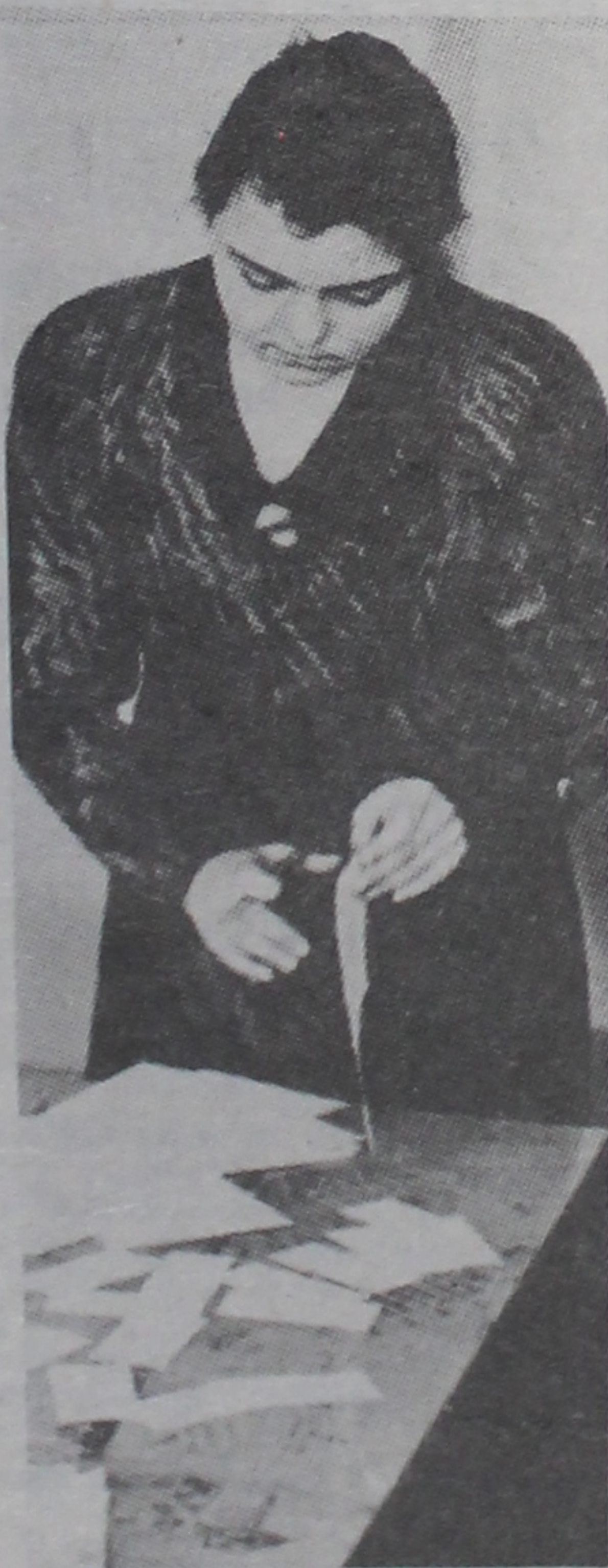
Дзе ж ён, самы лёгкі білет?