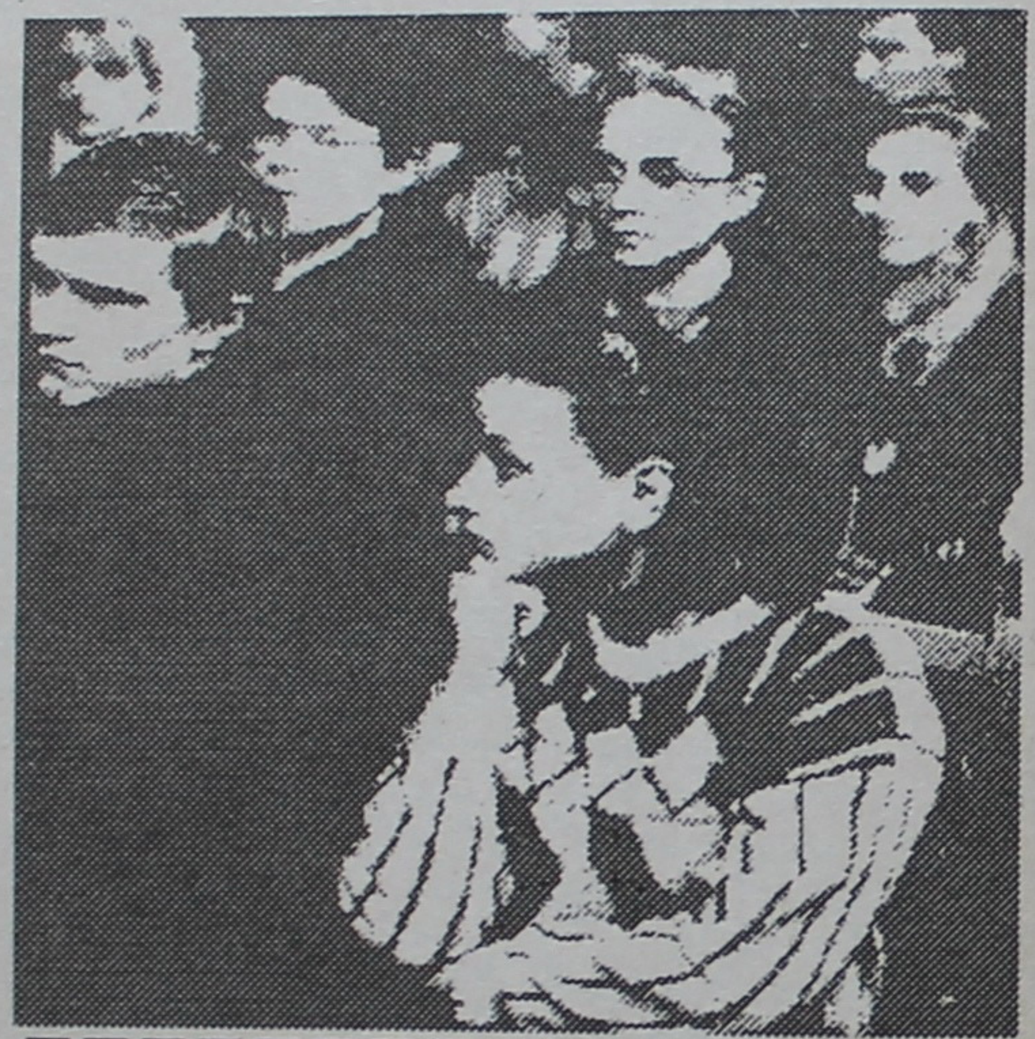
ЗААЛОГІЯ -- ГЭТА ПОШУК

тага калектыву -- гэта рэпетыцыі, выступленні, шматлікія гастролі. Гомельскія баяністы выступалі ў Францыі і Польшчы. Іх канцэрты заўсёды праходзяць з вялікім поспехам. У праграме канцэртаў -- творы розных аўтараў, народная і класічная музыка. Студэнты, якія прысутнічалі на сустрэчы, праслухалі фаннаграму канцэртных запісаў музычнага квартэта.