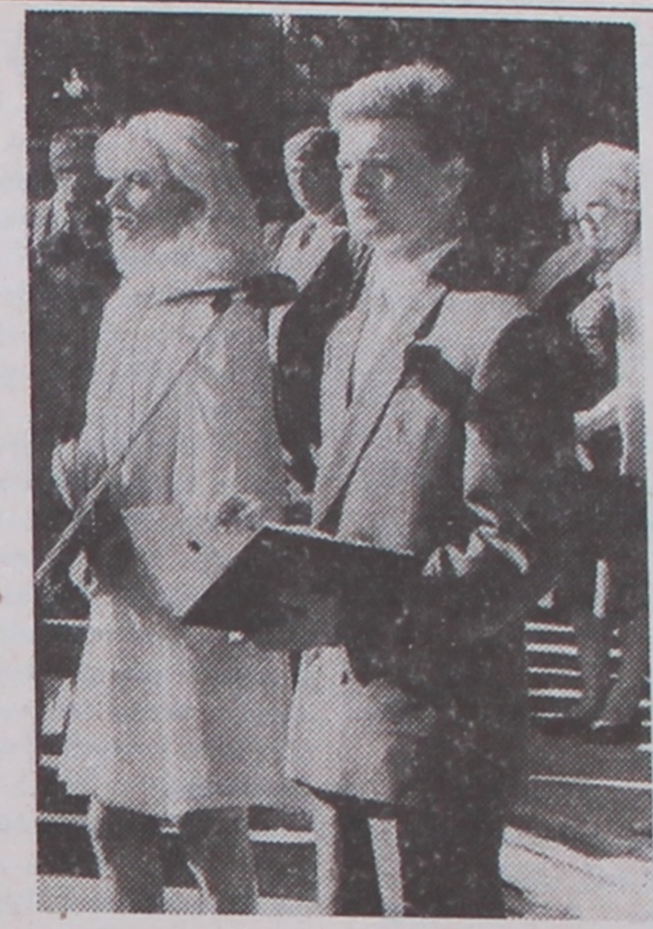
На свяце ўзнясла гучалі словы вядучых.

"Яко свет превышает над темности тако и мудрый над глупаго. Доконано