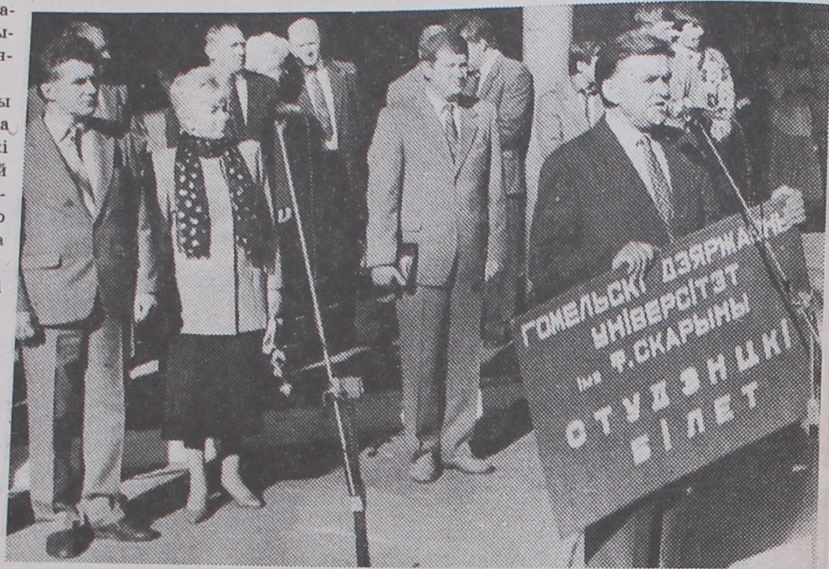
Ля мікрафона -- рэктар універсітэта Л.А.Шамяткоў

... Гучаць фанфары. Як толькі яны заціхаюць, да мікрафонаў падыходзяць вядучыя ўрачыстасці і прадстаўляюць слова рэктару доктару фізіка-матэматычных навук, прафесару, члену-карэспандэнта АНБ, заслужанаму дзеячу навукі