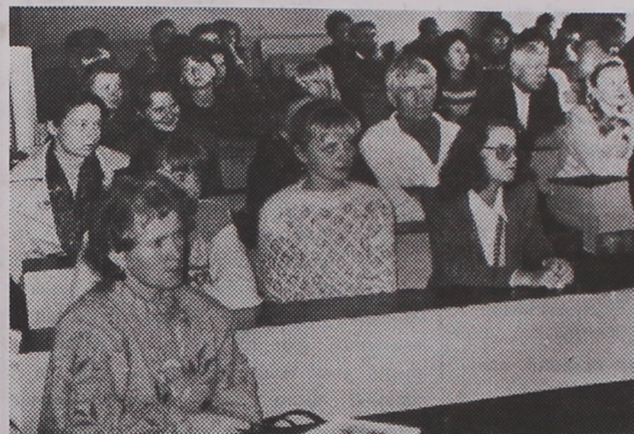
Кожнае выступленне слухалі з вялікай увагай.

С.АЛЕШКА, дэкан біялагічнага факультэта. В.ВАЛІТАЎ, доктар біялагічных навук, прафесар кафедры батанікі і фізіялогіі раслін.