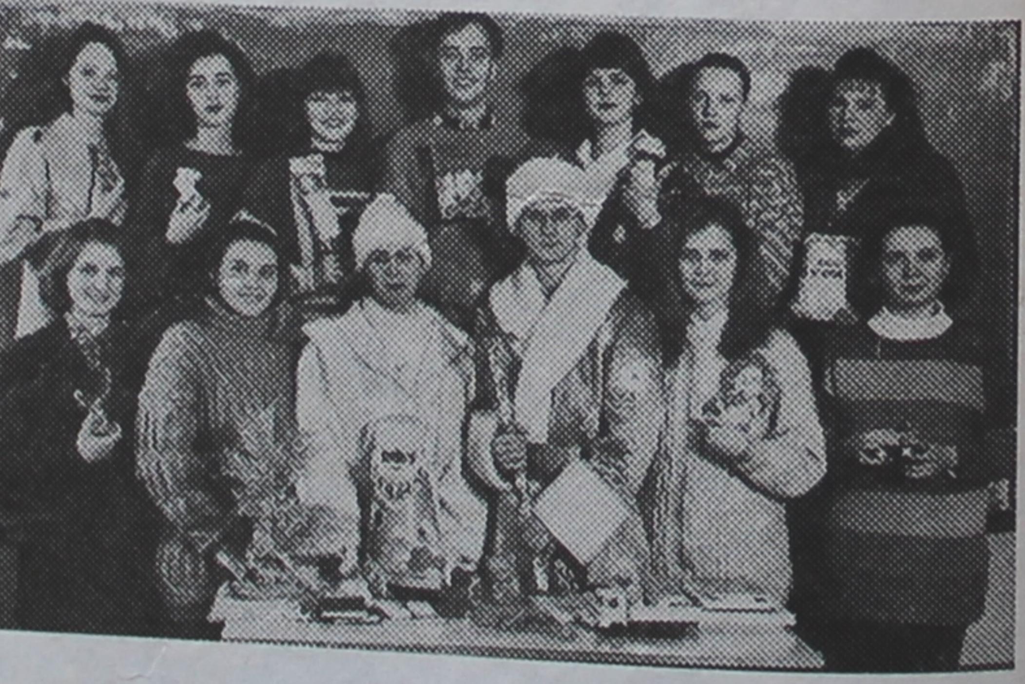
На здымку: студэнты спецыяльнасці "Матэматыка" завочнага факультэта з сабранымі навагоднімі падарункамі.

даты прадугледжана правесці шэраг важных мерапрыемстваў. У прыватнасці, на біялагічным факультэце нашага універсітэта вырашана адкрыць радыялагічную лабараторыю.