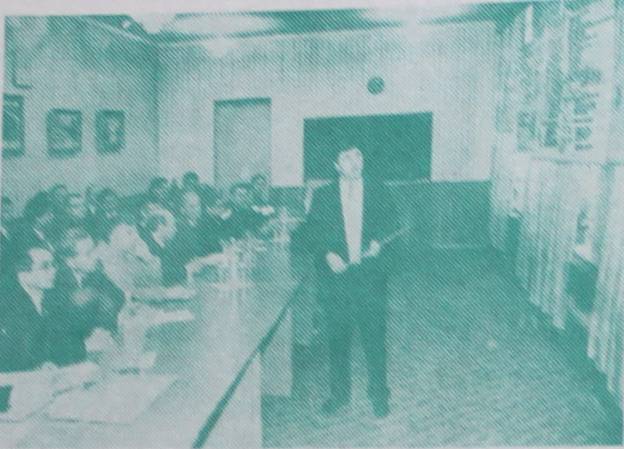
Ідзе абарона дысертацый.

абароне дысертацый, з'яўляліся апанентамі саіскальнікаў вучоных ступеняў. Широкая геаграфія на-