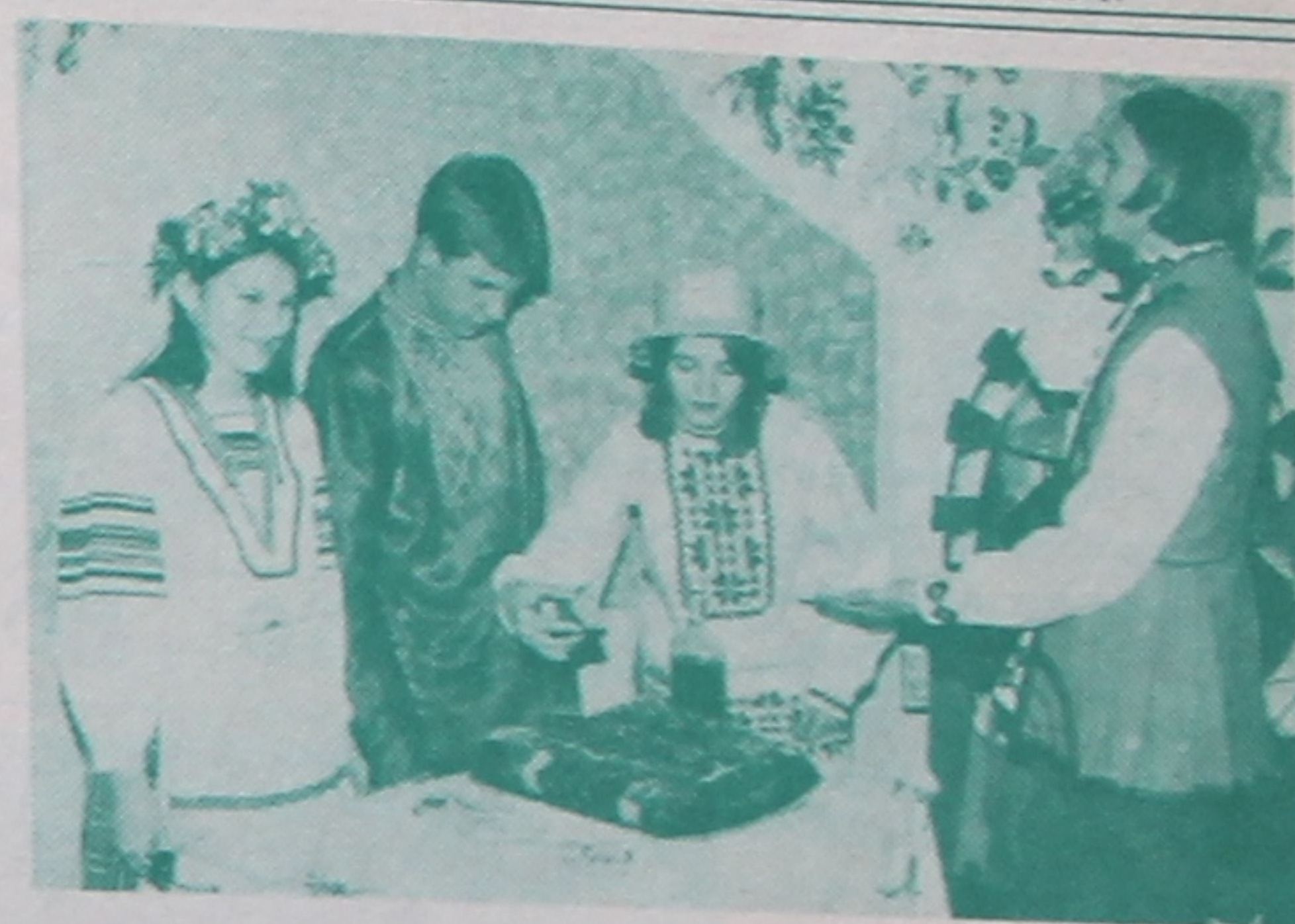
нявесты, заручыны, "зборная субота" або вяночкі, ад'езд маладых у царкву і самы кульмінацыйны момант -- дзяльба каравая -- сімвала дабрабыту, шчаслівага сямейнага жыцця.