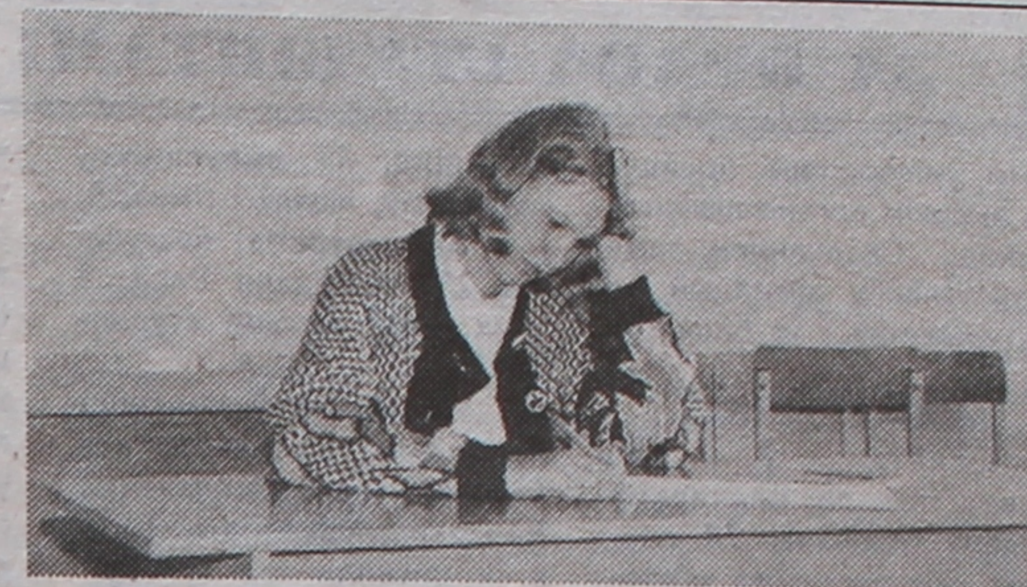
Ёсць над чым падумаць.

У апошнія гады не працягвае здзіўляць фізічны факультэт, дзе, па сутнасці, не існуе ніякага конкурсу. Вось і сёлета на 25 планавых месцаў педагагічнага патоку заявы падало столькі ж абітурыентаў. І ўсе яны сталі перша-