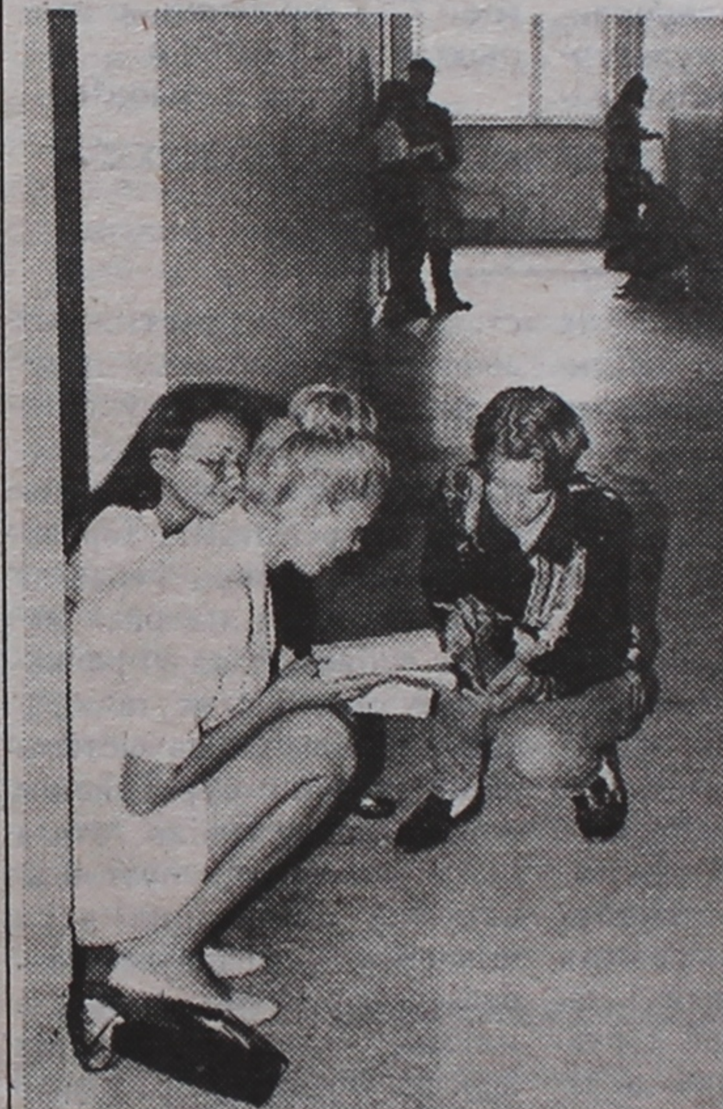
Як хочацца нічога не забываць.

Хаця сёлета конкурсныя паказчыкі аказаліся прыкметна ніжэйшымі за леташнія, а вось праходныя балы наадварот узраслі. Дастаткова скажаць, што яны павысіліся на 9 спецыяльнасцях і толькі на адной знізіліся, а па астатніх аказаліся адзначанымі. Што тычыцца правазнаўства, то на гэтую спецыяльнасць здавалі 4 уступныя экзамены і каб стаць студэнтам, патрэбна было