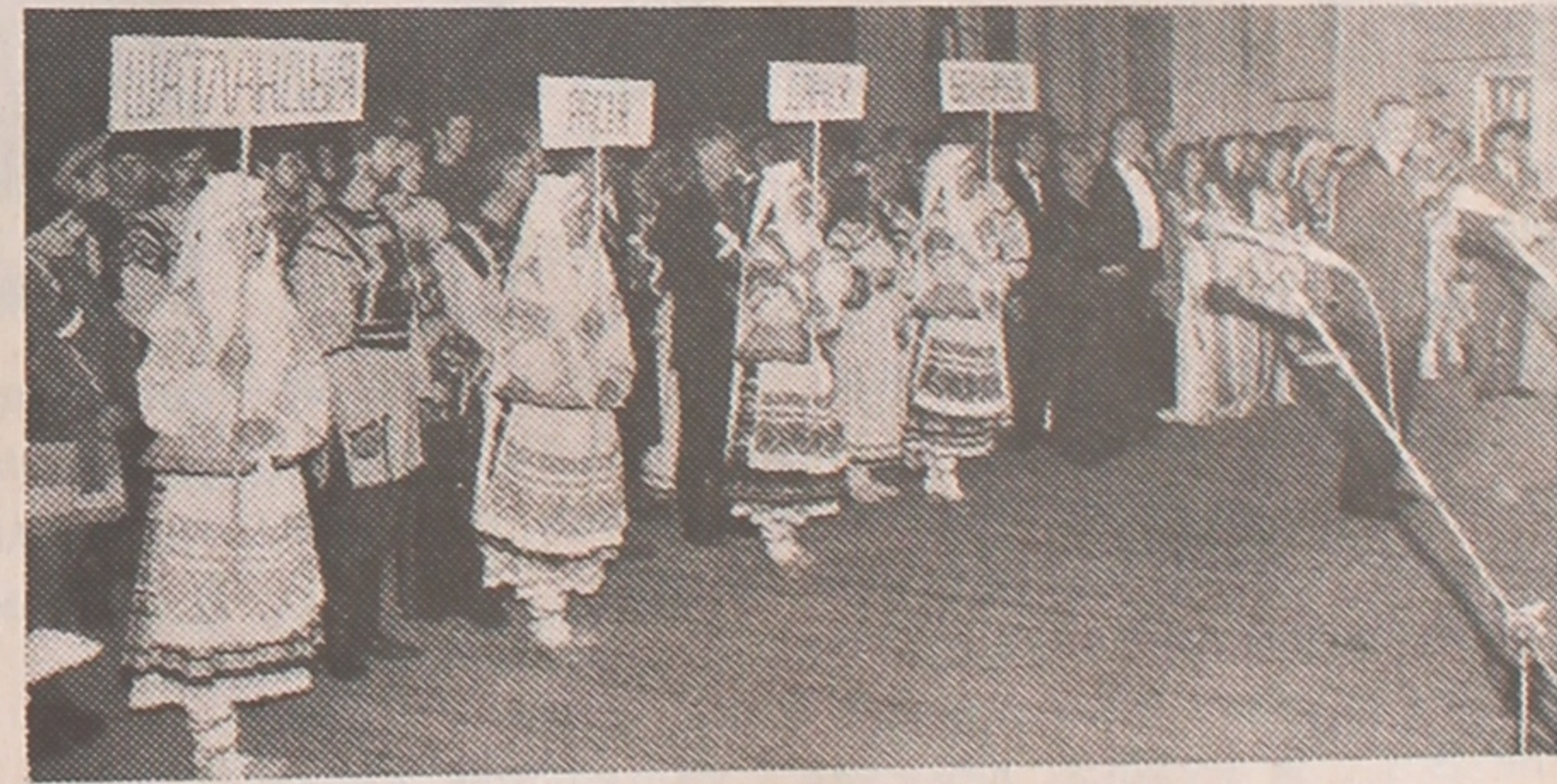
Парад удзельнікаў фестывалю.

Сёлета фестываль "узлялі пад сваё крыло" Дзяржаўны камітэт па справах моладзі Рэспублікі Беларусь, Міністэрства адукацыі краіны, абласны і гарадскі выканаўчы