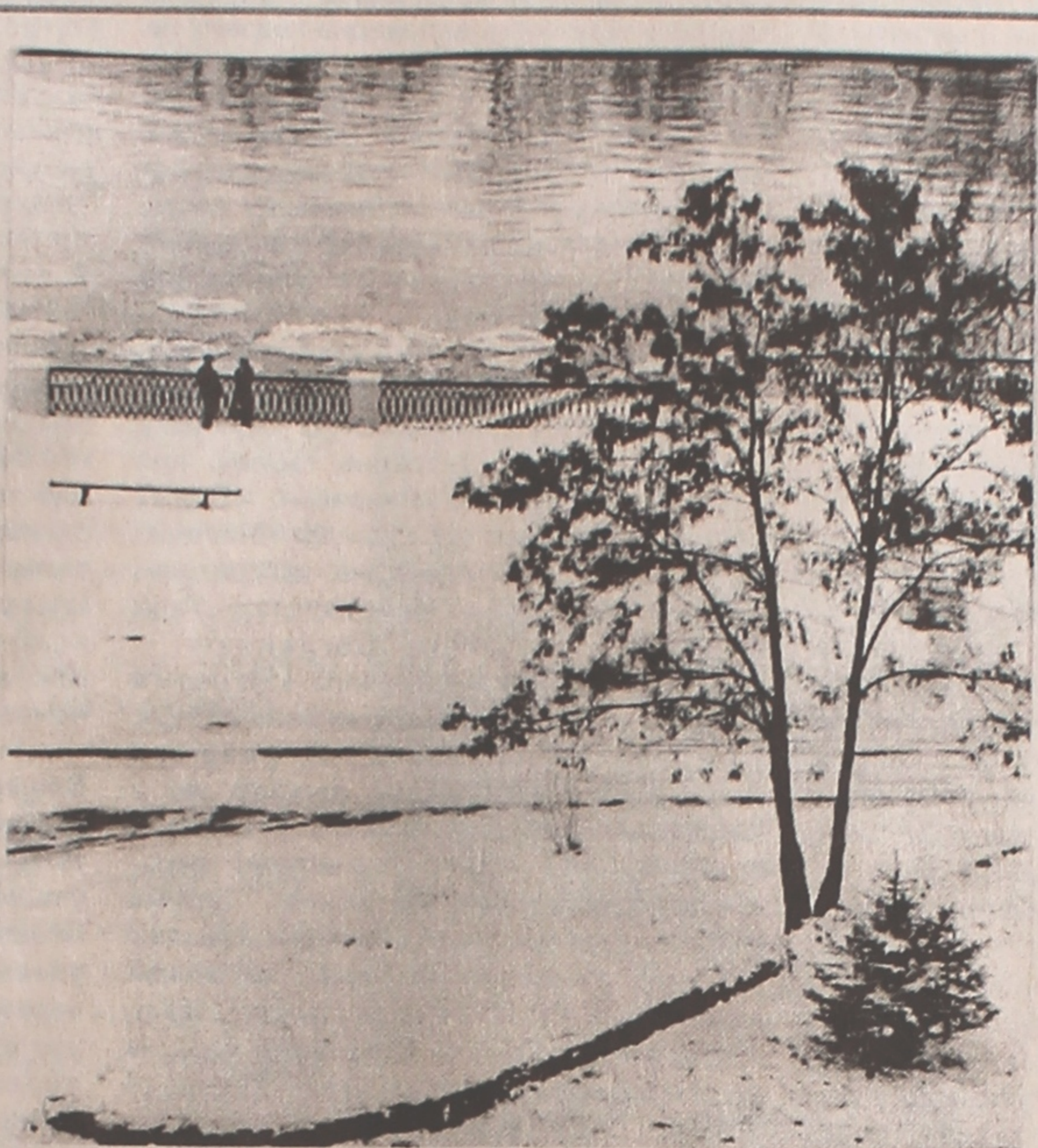
Зноў прыйшла да нас зима.