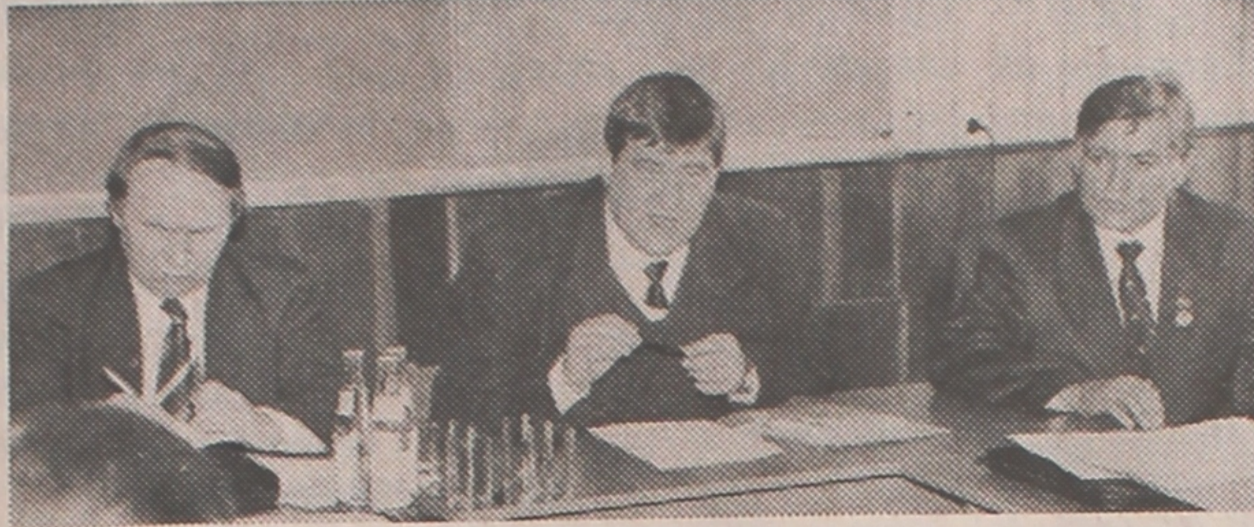
На здымку: у цэнтры — міністр адукацыі Рэспублікі Беларусь В.І.Стражаў, злева -- прэзідэнт Міжнароднай акадэміі навук вышэйшай школы В.Я.Шукшуноў, справа -- рэктар ГДУ Л.А.Шамяткоў у час пасяджэння акадэмікаў названай акадэміі.