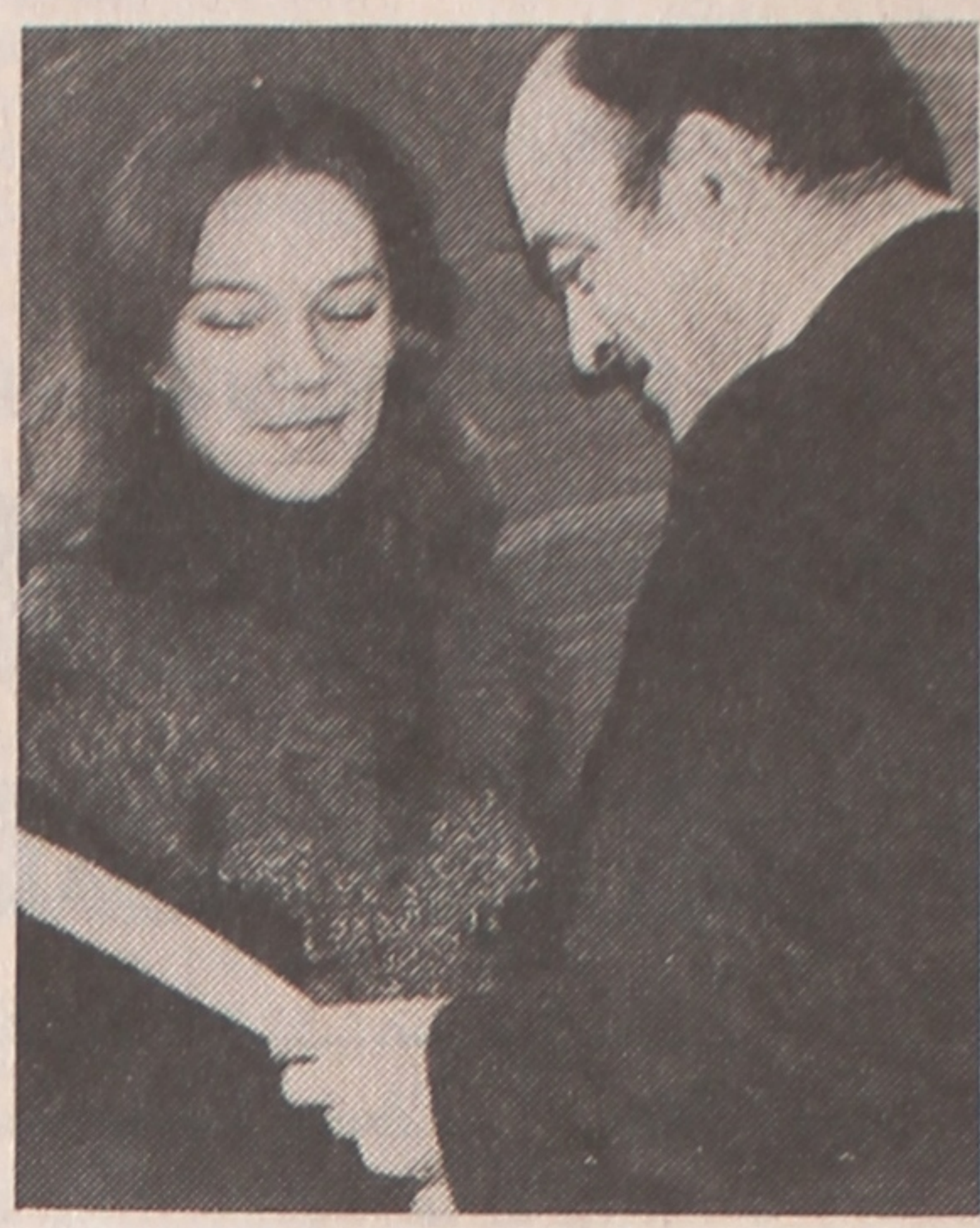
стварэння такога сумеснага інстытута як у плане навучання студэнткай

атрыманы дыпламы. Пан пасол адзначыў тады вялікую важнасць