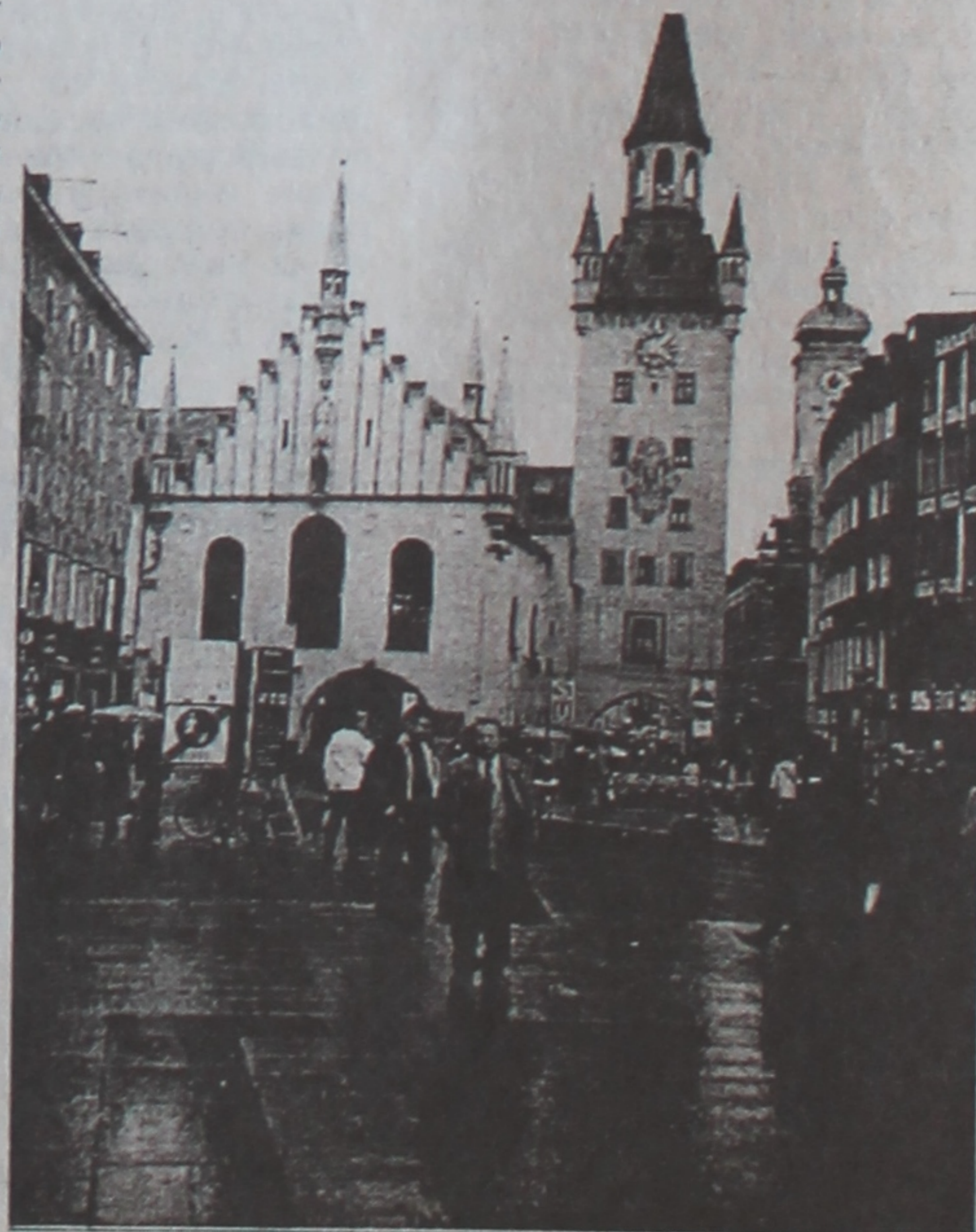
На одной з плошчаў Мюнхена.

Г.СЕРБІН дэкан геолога-геаграфічнага факультэта, дацэнт.