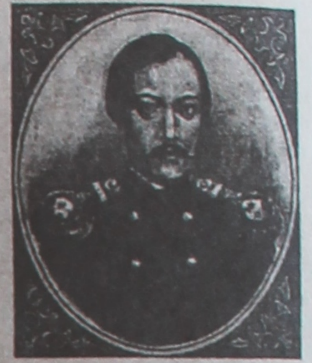
Казашскі вучоны, просветель, дэмакрат ЧОКАН ВАЛІХАНОВ і ШОҚАН УАЛІХАНОВ 1835 — 1898

экспедыцыях у Сярэднюю Азію і Кітай. У 1858 г. у Кашгары сабраў матэрыялы па этнаграфіі Усходняга Туркестана і гісторыі Алтышара. У Пецярбургу Валіханаў пазнаёміўся з прадстаўнікамі перадавой інтэлігенцыі — Г.Н.Патаніным, А.Н.Бекетавым, Ф.М.Дастаеўскім. У 1867 г. было ўтворана Туркестанскае генерал-губернатарства. Горад стаў хутка расці. Сёння Туркестан перажывае другую маладосць. Пабудаваны комплекс студэнцкага гарадка Міжнароднага казахска-турэцкага Універсітэта імя Хаджа Ахмеда Ясаві. Юбілей Туркестана стаў у Казахстане галоўнай культурнай падзеяй канца XX ст. Аляксандр САКАЛОЎ, студэнт гр. ЭК-11 геалага-геаграфічнага факультэта.